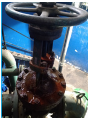
O equipamento antes das trocas

A ETA Itacolomi tem capacidade nominal de produção de 50 litros por segundo e é responsável pelo abastecimento nos bairros: Alto das Dores, Santa Cruz, Santa Efigênia, Padre Faria, Nossa Senhora do Carmo, Bauxita, Vila Operária, Vila dos Engenheiros, Jardim Itacolomi, Lagoa, Vila Aparecida, Novo Horizonte e parte do bairro Antônio Dias.