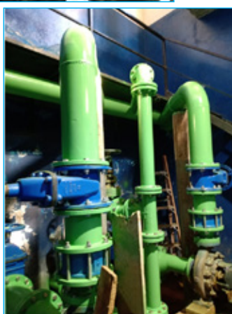
Sistema após as manutenções