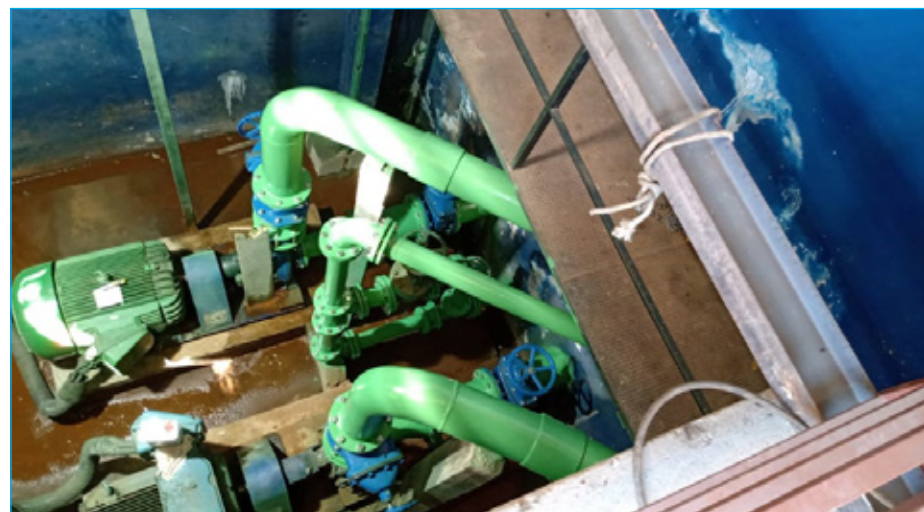
Sistema após as manutenções

Uma Estação de Tratamento de Água (ETA) é responsável por garantir os padrões de potabilidade para o consumo humano. O objetivo durante o processo é melhorar a qualidade da água ao eliminar os materiais orgânicos e micro-organismos patogênicos, para que ela não apresente riscos para a saúde pública e assim possa ser consumida com segurança. Em Ouro Preto há seis ETAs. A ETA Itacolomi, uma das principais, passou por intervenções importantes