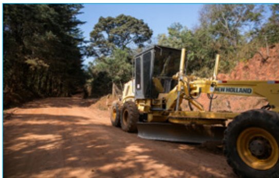
Obras de preparação de asfaltamento da estrada do Riacho em Amarantina