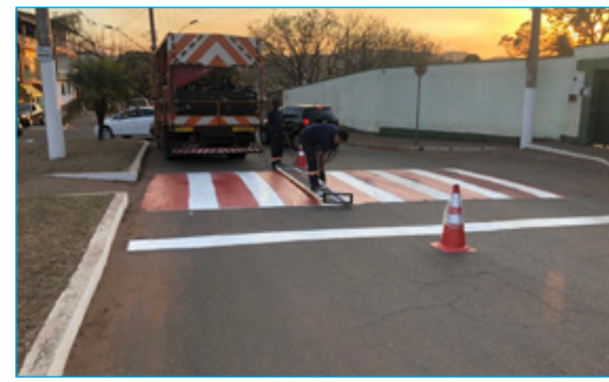
Com a finalização de implantação asfáltica, a Av. JK, no bairro Bauxita, agora conta com uma faixa de pedestre para a segurança de seus usuários

O executivo de Ouro Preto segue tocando obras nos distritos e distrito sede, com foco especial para as questões viárias e de saneamento que afligem diversas comunidades há décadas. Nesta última semana foram finalizadas faixa de pedestre na Av. JK, preparação para asfaltamento do Riacho em Amarantina, e preparação da estrada para receber asfalto em São Bartolomeu.