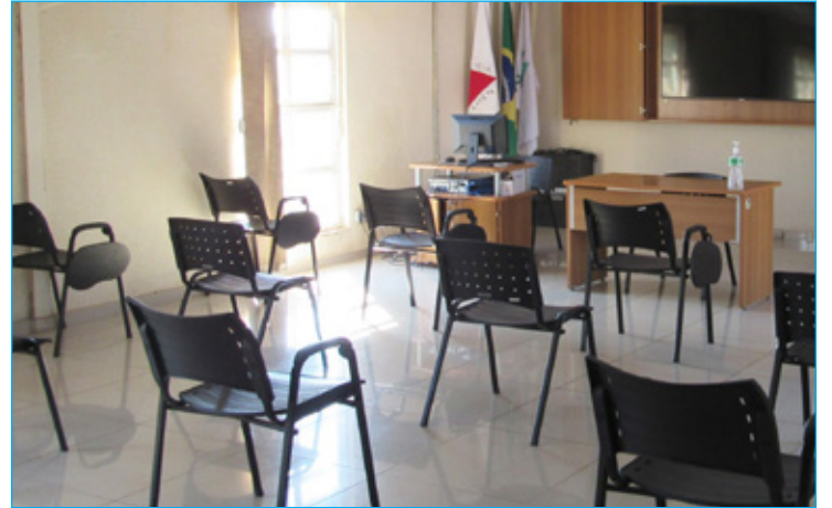
Distanciamento mínimo de 1,5m entre os participantes é uma das medidas de segurança adotadas para realização da Assembleia presencial

Medidas adotadas para realização da AGO com segurança: - Uso obrigatório da máscara durante toda a apresentação; - Distanciamento mínimo de 1 metro e meio nas filas e entre os assentos; - Aferição da temperatura corporal antes da entrada no local; - Disponibilização de álcool em gel para higienização das mãos; - Realização da apresentação de forma mais compacta, reduzindo o tempo de permanência no local.