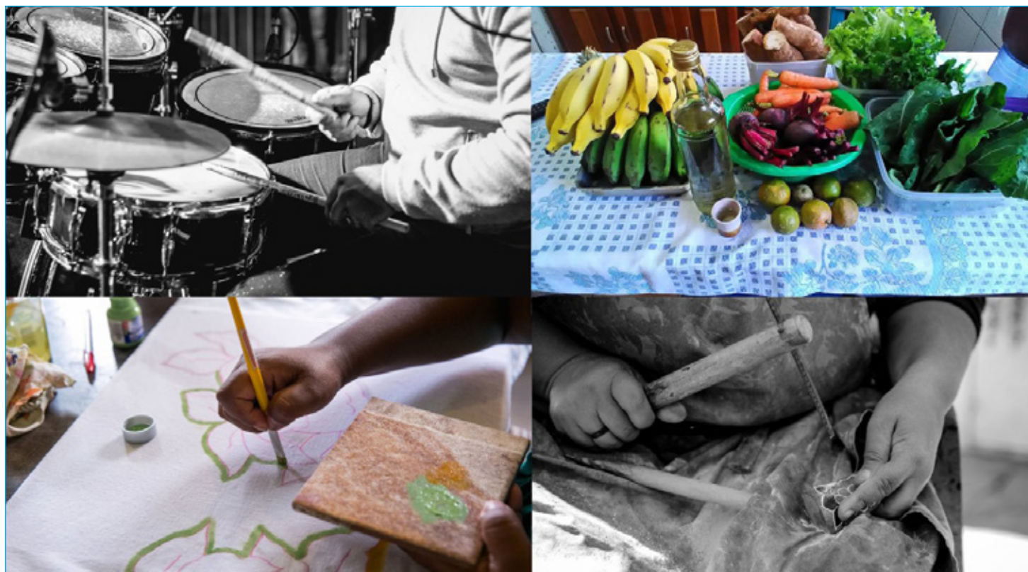
Auxílio visa profissionais mais afetados pela pandemia, dentre outros setores da população ouro-pretana

Prefeitura de Ouro Preto lançou programa de complementação de renda, voltado para camada de-sassistida da população, durante a crise do Coronavírus. Confira os detalhes na