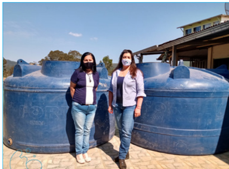
Capacidade dos reservatórios é de 10 mil litros, quatro vezes mais que a capacidade atual

"A caixa d'água é um item muito importante para todos os imóveis, pois pode evitar que o morador fique sem água durante as paradas no fornecimento em função das manutenções", ressalta a superintendente. A caixa d'água deve ter capacidade equivalente ao consumo de pelo menos 24 horas, de acordo com as normas técnicas vigentes e a limpeza deve ser realizada a cada seis meses.