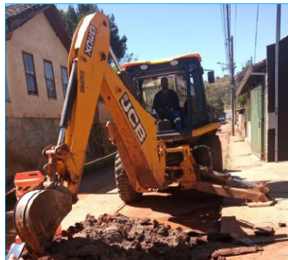
Intervenção na rua Tombadouro

Colabore, adote hábitos sustentáveis. Faça uso racional da água", frisa.