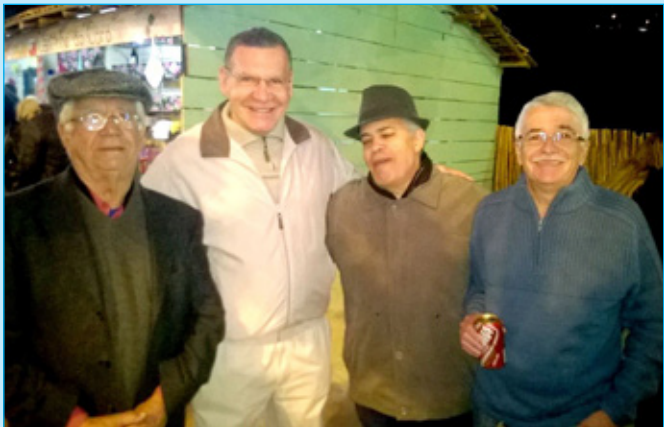
Julifest tem uma magia capaz de unir gerações para curtir o mesmo show, reencontrar amigos de outros tempos, congregar vizinhos e curtir a alegria nas barracas. Isto não tem preço. (J. A. Braga)

Para refletir: Não nos lembramos de dias, lembramo-nos de momentos. (Cesare Pavese)