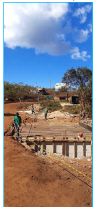
Obras na ponte sobre o Ribeirão Três Moinhos