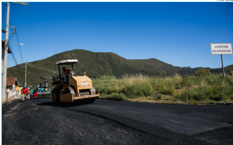
Rua Antônio Esteves Sacramento já está recebendo asfalto