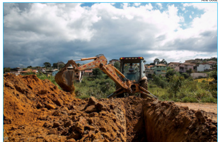
Obras na Avenida Metalúrgicos

"Iniciamos as obras de infraestrutura. Estamos assegurando a qualidade de vida dos moradores. E estamos felizes por isso. Tramita na Câmara um projeto para obtermos recursos junto ao governo do Esta-