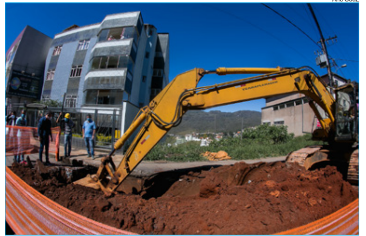
Obras na JK tiveram início dia 11