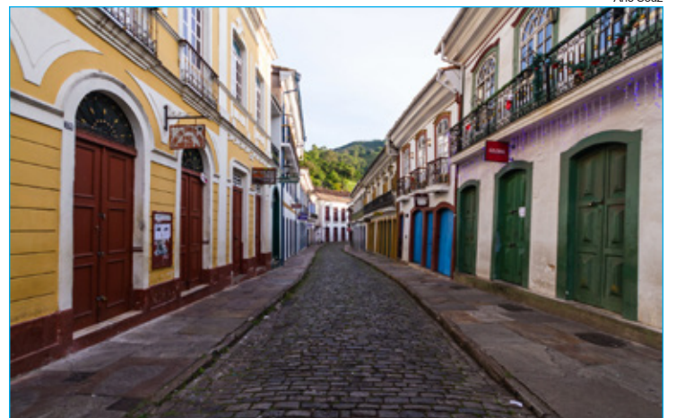
Comércio em Ouro Preto encontra-se fechado devido ao isolamento social

Essa pesquisa levou em conta a avaliação de eixos como empreendedorismo, educação, tecnologia e inovação, meio ambiente,