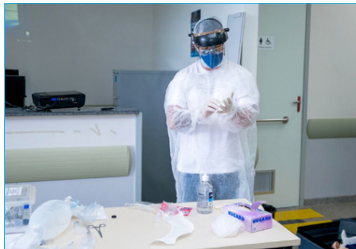
Capacitação aos profissionais de saúde

Dividido em dois dias, o treinamento abordou, dentre outros assuntos, o uso e descarte corretos de EPI's, as formas corretas de paramentação para os diversos tipos de atendimento e contato com pacientes, procedimento de intubação no Covid-19, protocolo de coletas de exames e manobras de