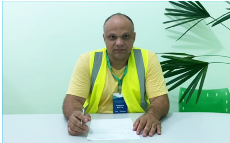
Secretário de Saúde confirma caso fatal por COVID-19 em Mariana

Até o momento, Mariana já registrou 1 óbito ocasionado pelo COVID-19, 2 casos confirmados, 19 sob investigação e outros 11 já foram descartados. Eles são monitorados pela Secretaria de Saúde, conforme o Protocolo disponibilizado pela Secretaria Estadual de Saúde.