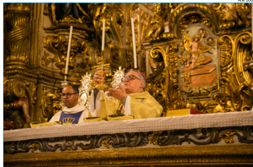
Arquidiocese de Mariana suspende oficialmente as celebrações públicas da Semana Santa