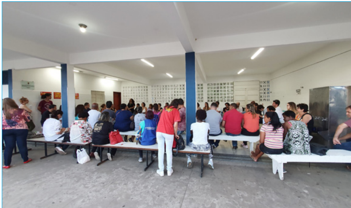
Reunião Geral do Comando de Greve de Ouro Preto, na Escola Estadual Dom Velloso