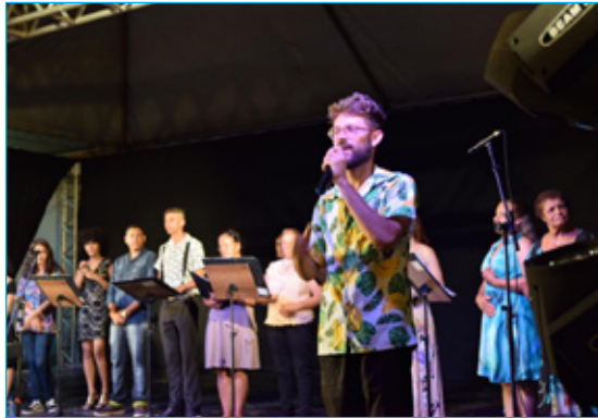
Coral do Cras e Amor Exigente encantou a plateia

Apresentações de Coral e Ballet Clássico encantam público no último domingo (1)