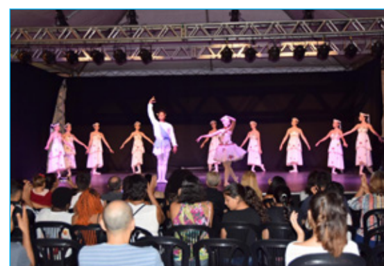
Natal Iluminado 2019 terá diversas atrações gratuitas para o público