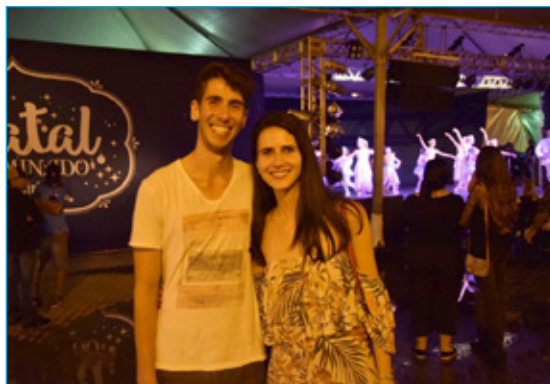
Casal veio de Cachoeira do Campo e se encantou com apresentação de balé clássico