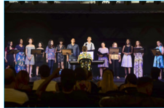
Apresentação Entre Princípios abrilhantou a noite de atrações na Praça da Estação