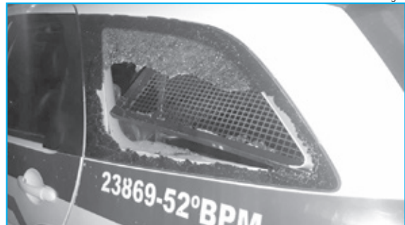
Viatura teve o vidro quebrado durante a diligência