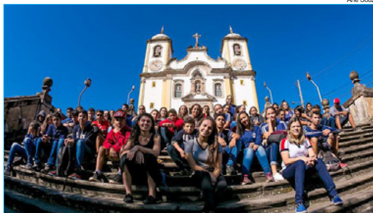
Alunos visitam Igreja de Santa Efigênia

tância em promover o contato direto dos alunos com esses lugares. “Como professora, considero de extrema importância que os alunos possam conhecer a Mina Chico Rei, bem como as Igrejas de Santa Efigênia e Nossa Senhora do Rosário dos Ho-