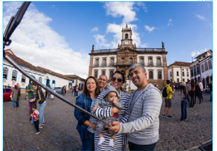
Turistas na Praça Tiradentes no mês de junho/2019

Em meio ao patrimônio do centro histórico, com o charme dos casarões e ladeiras, os turistas têm várias opções de lugares para conhecer em uma visita que mescla lazer e conhecimento. A Casa dos Contos, antigo local de pesagem e fundição de ouro, o Museu da Inconfidência, que foi a Casa de Câmara e Cadeia, diversas igrejas, incluindo a Igreja de São Francisco de Assis, projetada por Aleijadinho em uma arquitetura colonial rococó, que tem em seu interior pinturas de Mestre Ataíde. O Parque Estadual do Itacolomi é uma área de preservação ambiental que conta com trilhas, lagoa, museu, capelas e é claro, o Pico do Itacolomi, seu principal símbolo que está a 1.772 m de altitude.