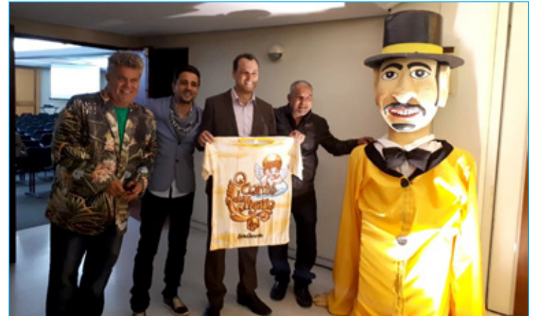
Ouro Preto será tema da Escola de Samba São Clemente