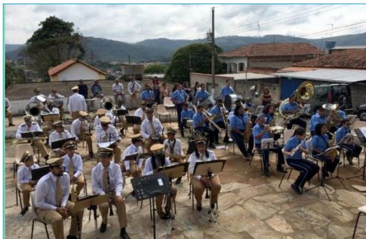
A Associação dos Moradores do bairro São José agradece a participação e colaboração das bandas Sociedade Musical Santa Cecília de Passagem de Mariana e União Social por terem abrilhantado o Café na Praça, no dia 2 de junho de 2019 em Cachoeira do Campo.