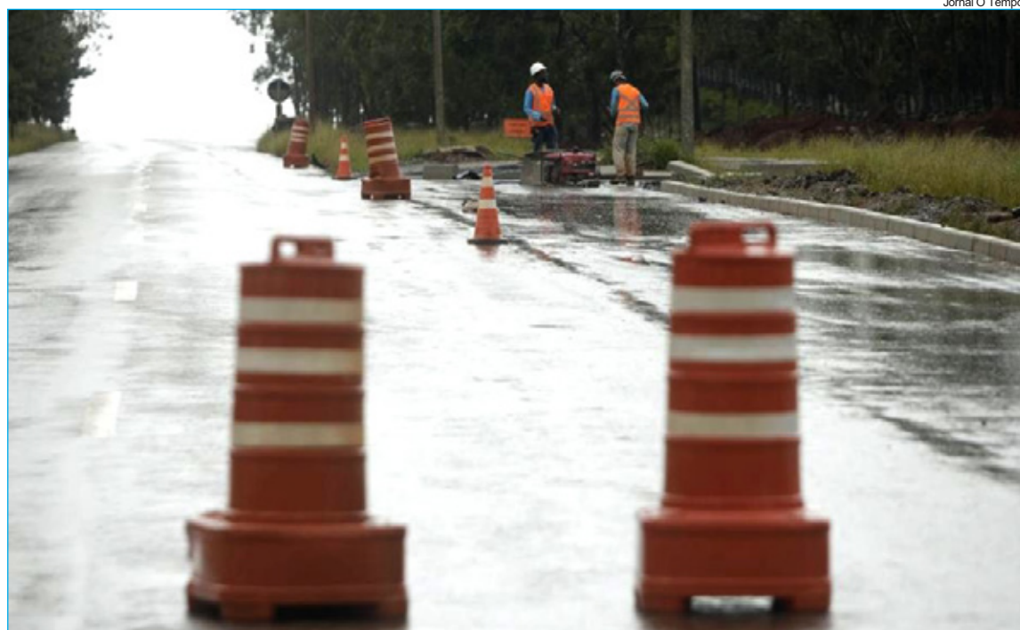
Jornal O Tempo

O trânsito entre os km 37 e 40, na BR-356, que desde o dia 21 de fevereiro vinha sendo realizado no sistema “Pare e Siga”, foi liberado na noite da quarta-feira (17). A medida visava a segurança dos motoristas, pois a rodovia poderia ser atingida em um possível rompimento da Mina Vagem Grande, em Nova Lima. A decisão de liberar a via, que está na região de Itabirito, foi após a assinatura de um Termo de Ajuste de Conduta (TAC), durante uma audiência, que aconteceu na tarde da terça-feira (16), em Mariana. O encontro contou com a participação de representantes da Vale, Ministério Público, Defesa Civil, OAB e Polícia Militar.