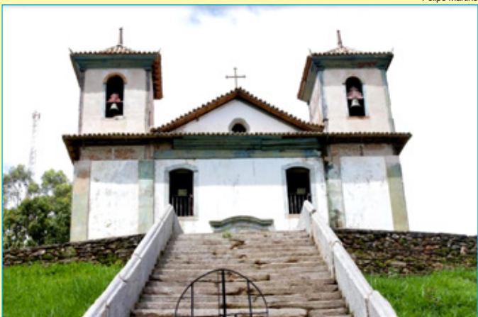
Igreja de Nossa Senhora da Conceição no distrito de Camargos, um dos mais antigos templos de Minas Gerais