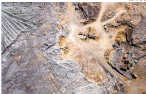
Parque das Mangabeiras na época da mineração