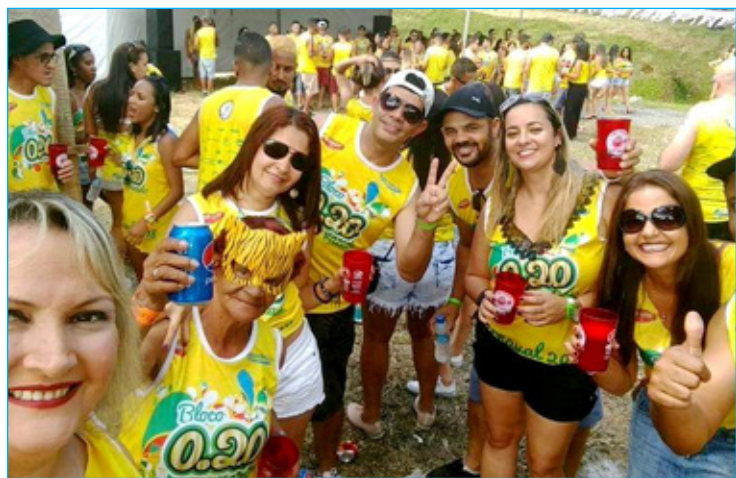
Edição de 2018