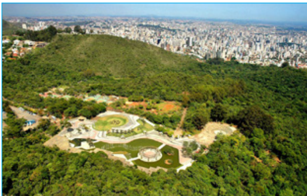
Parque das Mangabeiras revitalizado após descomissionamento de mina

A segurança de barragens de rejeito virou pauta constante após o ocorrido em Brumadinho, na Mina Córrego do Feijão, da Vale. Em Ouro Preto, a situação preocupa moradores e autoridades, visto que a cidade abriga 33 barragens. Uma delas é a do Marzagão, localizada no bairro Saramenha e de responsabilidade da Hindalco. Para falar sobre o monitoramento e a segurança da barragem, a empresa convidou a imprensa local para entrevista na quarta-feira (13) no Centro de Vivência da empresa.