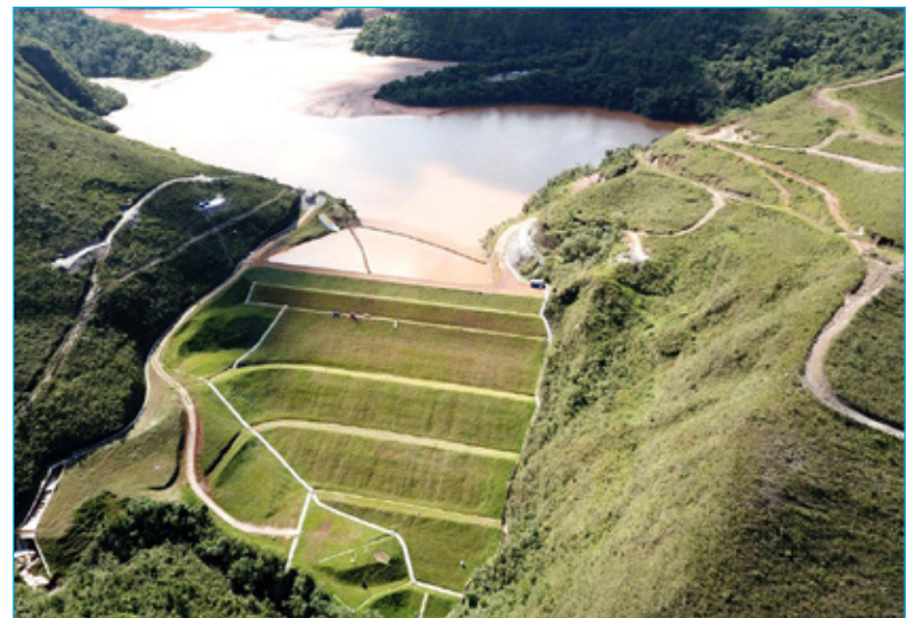
Mina de Marzagão atualmente

A coletiva de imprensa foi agenda após uma reunião entre os representantes da empresa e a comunidade, ocorrida no dia 30 de janeiro. Entre os assuntos debatidos nesse dia, a população queria saber qual o Plano de Atendimento Emergencial (PAE) da empresa e o Plano Hipotético de Ruptura, estudo define quais áreas seriam inundadas, em caso de rompimento. Na ocasião, a empresa disse que