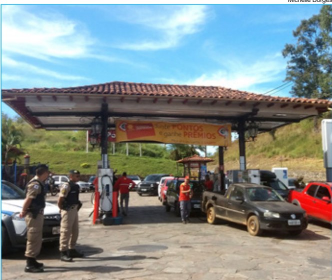
Postos onde havia combustível receberam reforço da PM para garantir a ordem no local

A paralisação dos caminhoneiros pelo país ainda encontra pontos de bloqueio, mas a maioria da categoria está desmobilizada. Na quarta-feira (10) o abastecimento foi retomado gradualmente e gerou grandes filas nos postos de abastecimentos. Diversos setores foram afetados, e de acordo com especialistas, a normalização dos serviços deve acontecer no mínimo em 10 dias.