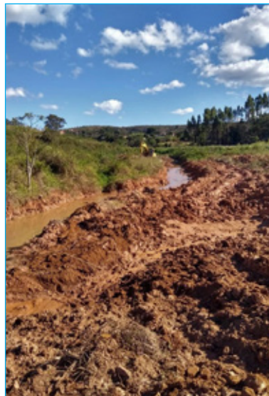
Obras no córrego do Prata em Santo Antônio do Leite

Ele complementa que fez uma indicação nesse sentido no ano passado