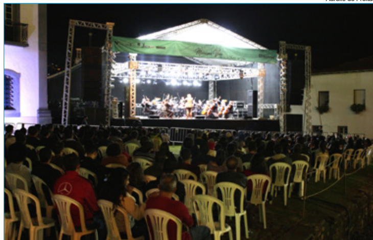
Aurélio de Freitas