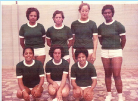
Equipe de Voley do União em passado recente