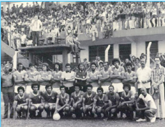
Futebol de Itabirito na década de 70