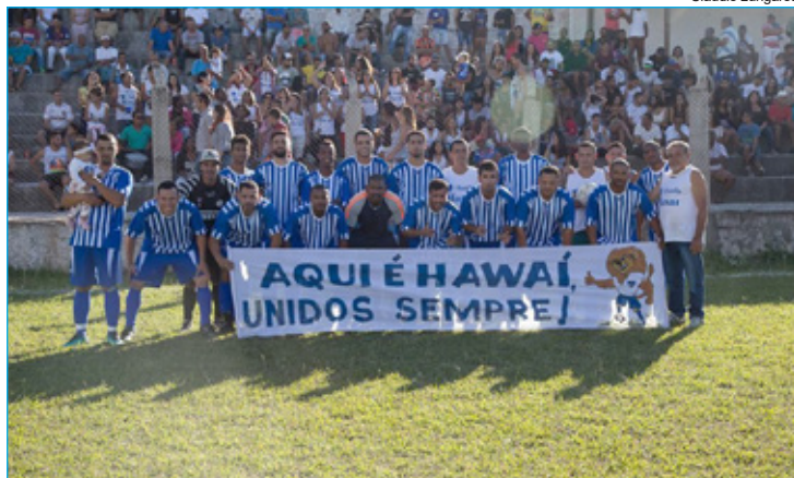
Havaí é Bicampeão do Cachoeirão, decidindo o título nos pênaltis