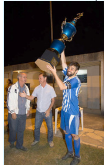
O capitão do Havaí, China, dono de um dos gols da partida que ficou em 2x2, levantou a Taça de campeão da equipe

O Dpro/Casa do Professor de Ouro Preto, através do Núcleo de Tecnologia Municipal torna pública a abertura das inscrições para os cursos e oficinas na área da Informática Educativa, com o objetivo de capacitar e incentivar os profissionais da educação no uso das novas Tecnologias da Informação e Comunicação. As inscrições podem ser realizadas até o dia 11 de maio pelo e-mail: smedepro@gmail.com, ou diretamente na Casa do Professor, na Rua Padre Rolim, 344 - Centro, de segunda à sexta-feira, no horário de 08 às 17h. Os cursos e oficinas terão início na segunda semana de maio de acordo com os cronogramas específicos.