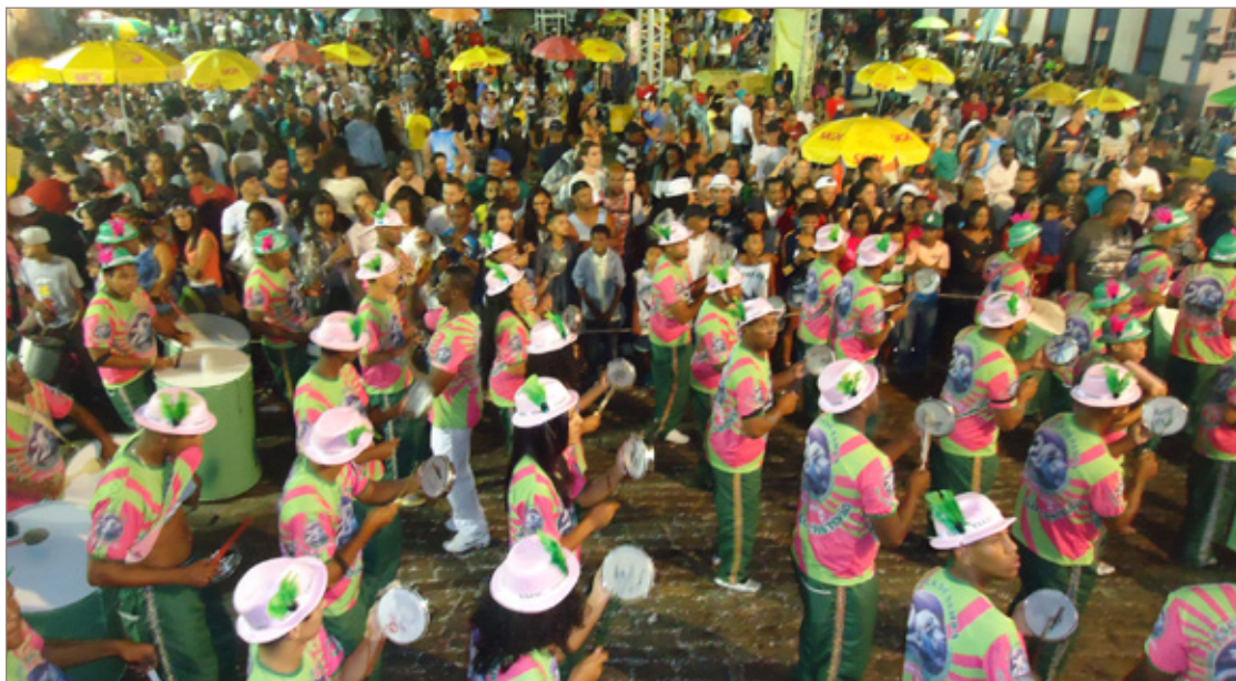
Em 2017 a bateria da escola São Cristóvão foi a grande vencedora do desfile

Na segunda-feira de carnaval, dia 12 de fevereiro, a Praça Tiradentes em Ouro Preto se transformará no palco de muita festa e alegria com os desfiles das escolas de samba da cidade. Neste ano, sete escolas confirmaram presença na folia, sendo elas Aliança da Piedade, União Recreativa de Cachoeira do Campo - URCA, Acadêmicos do São Cristóvão, Morro Santana, União Recreativa do Santa Cruz, Unidos do Padre Faria e Princesa Isabel.