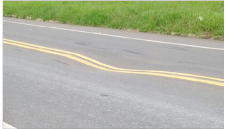
Motoristas perceberam o afundamento da via na noite do dia 29 de dezembro