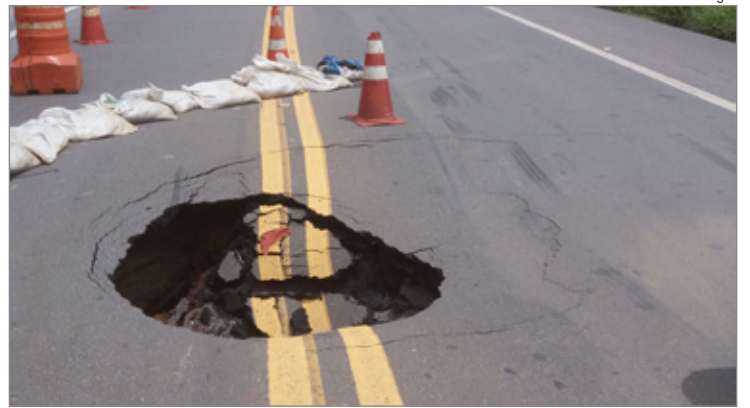
Com as fortes chuvas, o rompimento de um bueiro causou uma cratera na via

A princípio, a causa da deterioração do asfalto, de acordo com Moutinho, foi o rompimento de uma manilha que passa por baixo da via. “Estivemos com a equipe do DNIT no local, e as primeiras concepções são de que a manilha, que está a uma profundidade de aproximadamente