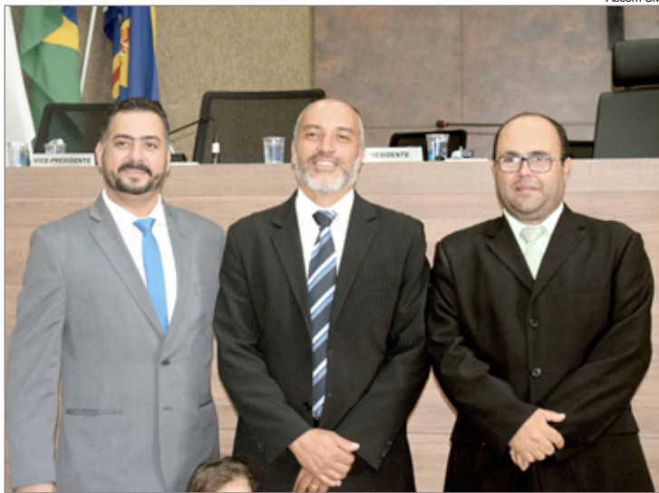
Nova mesa diretora gestão 2018