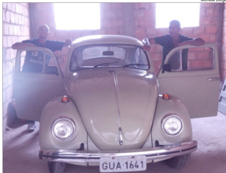
Carro foi totalmente reformado