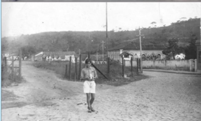
Dois momentos: Itabirito em 2017 e em 1923