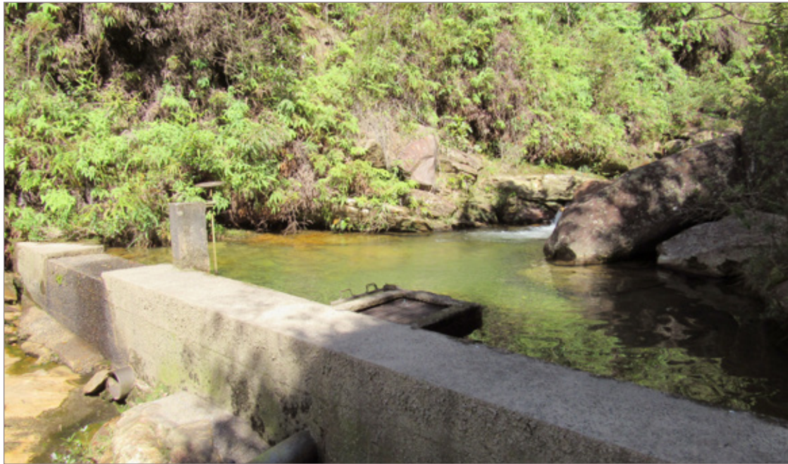
Captação ETA Itacolomi

O serviço de confecção das carteiras de identidade é oferecido de segunda a sexta-feira pelas Câmaras de Ouro Preto e Mariana. Para emissão do documento é necessária a apresentação dos seguintes documentos: solteiros: certidão de nascimento, casados: certidão de casamento, divorciados: certidão de casamento com averbação; duas fotos 3x4 recentes; CPF (opcional); DAE (Documento de Arrecadação Estadual) pago no valor de R$ 32,51 (somente em caso de 2ª via e demais vias; a 1ª via é gratuita); boletim de ocorrência em caso de perda ou roubo. O contato do CAC da Câmara de Ouro Preto é (31) 3552-8527 e o do CAC marianense é (31) 3557-6210.