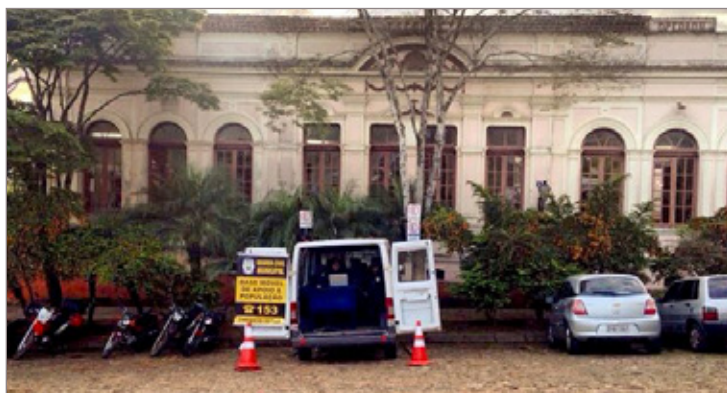
Base Móvel da Guarda Municipal funciona de segunda a sexta, de 7h às 18h e sábado de 9h às 18h