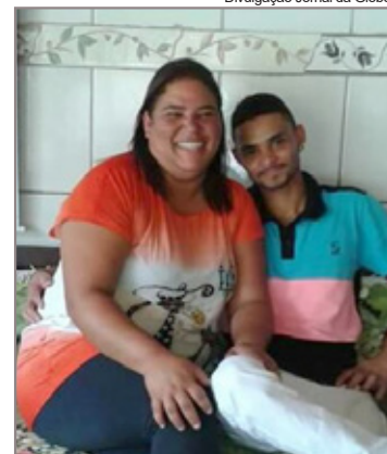
Ele com a mãe antes de viajar com a ex-namorada