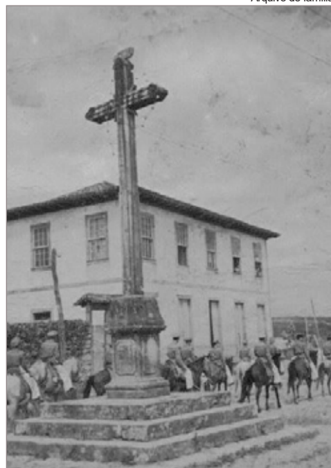
Solar dos Pedrosa na década de 1940

R. Afonso Maximiano, 120 - Cachoeira do Campo - (31)3553.1607