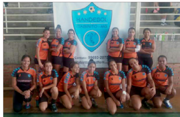
Equipe itabiriteense disputará o Campeonato Mineiro Juvenil de Handebol pela primeira vez