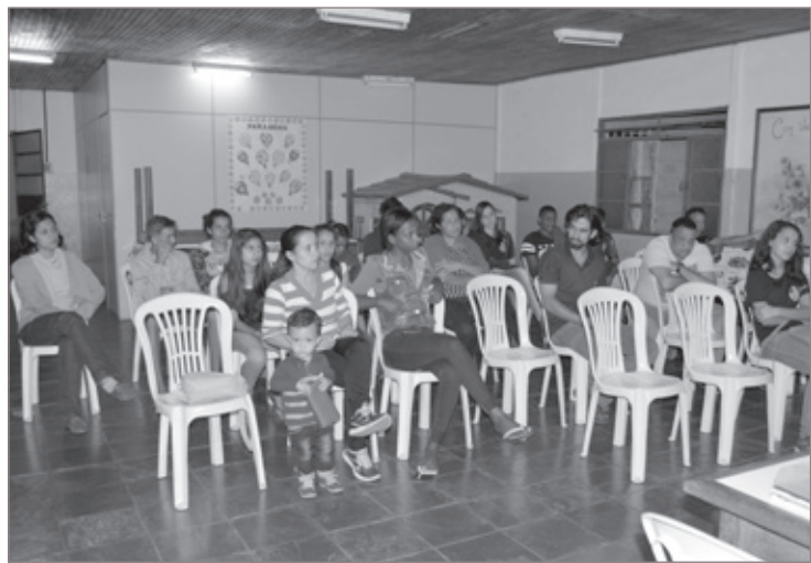
O SAAE Mariana se reuniu com os moradores do bairro Cabanas e do Vale Verde na noite do dia 3 de maio para ouvir as demandas da comunidade em relação aos serviços prestados pela autarquia.

Festival de Inverno de Ouro Preto e Mariana recebe inscrições para propostas de eventos e oficinas até o dia 21 de maio. O Festival, que completa 50 anos, será realizado entre os dias 8 e 23 de julho. As inscrições são gratuitas e realizadas exclusivamente no site do Festival, no endereço festivaldeinverno.ufop.br