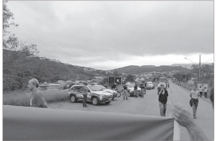
Em Mariana, manifestantes pararam a BR-356 por duas

Em Mariana, houve ainda paralisação da BR-356. Cerca de 50 trabalhadores paralisaram a rodovia por volta das 04h 30 da madrugada, durante duas horas. De acordo com organizadores do ato, pessoas que tentaram furar o