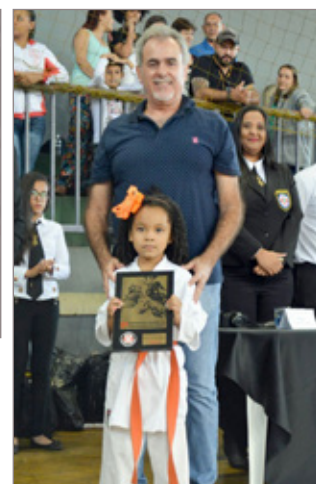
Com “casa cheia”, evento contou com a presença do Prefeito Alex Salvador