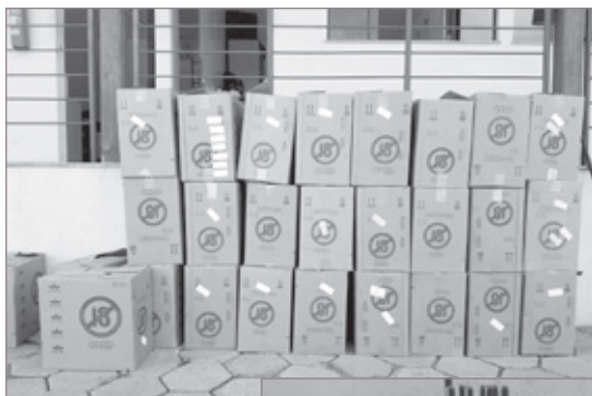
Carga roubada recuperada pela Polícia Militar, em Ouro Preto

Em diligências, o Pálio, foi localizado e apreendido e foi verificado que a van e o Pálio são produtos de crime, sendo os mesmos recolhidos para o pátio credenciado. O autor preso foi conduzido para a Delegacia de Polícia Civil, junto à carga recuperada pela Polícia Militar.