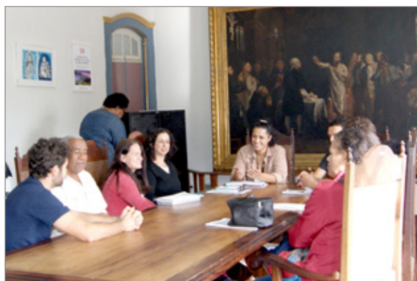
Reunião entre Deti, CAC e Casa do Professor para debater o novo formato do Escola Digital

As atividades do Escola Digital estão previstas para começarem em agosto deste ano, e a as escolas devem ser atendidas durante todo o segundo semestre.