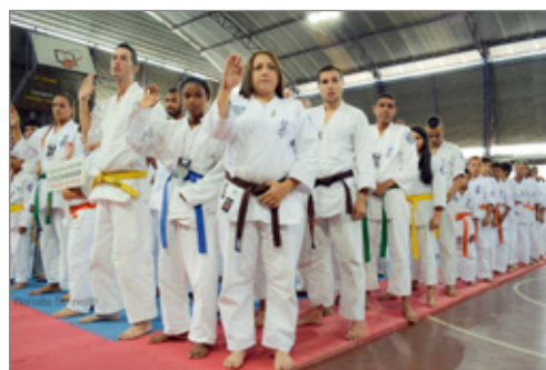
Competição reuniu mais de 130 caratecas, de 35 categorias, em Itabirito