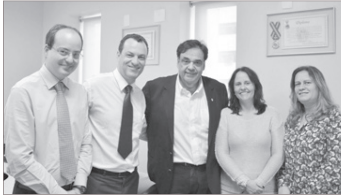
Deputado Thiago Cota; prefeito de Ouro Preto, Júlio Pimenta; Secretário de Estado de Saúde, Sávio Souza Cruz; Secretária Municipal de Saúde de Ouro Preto, Flávia Perdigão e a Administradora da Santa Casa de Ouro Preto, Adriana dos Santos

Por meio do esforço do prefeito de Ouro Preto, Júlio Pimenta, e do deputado estadual Thiago Cota, ficou acordado na terça-feira, 24 de abril, o pagamento das parcelas atrasadas referentes aos meses de fevereiro e março deste ano. O valor de R$400 mil reais é referente ao convênio Rede Resposta firmado entre o Governo do Estado e o Hospital Santa Casa de Ouro Preto. O comunicado foi realizado pelo secretário de Estado de Saúde, Sávio Souza Cruz, em reunião com Júlio Pimenta, Thiago Cota, com a interventora da Santa Casa de Ouro Preto, Adriana dos Santos, e com a secretária municipal de Saúde, Flávia Perdigão, no gabinete do deputado na Assembleia Legislativa de Minas Gerais.