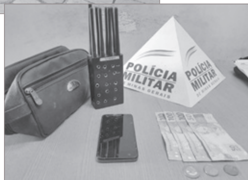
Material apreendido pela Polícia Militar, durante recuperação de carga roubada