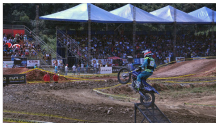
Itabirito se transformou na capital mineira do motocross no último fim de semana