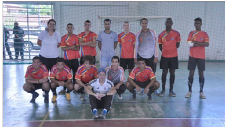
Campeões masculinos e femininos de cada modalidade garantiram vaga na fase microrregional