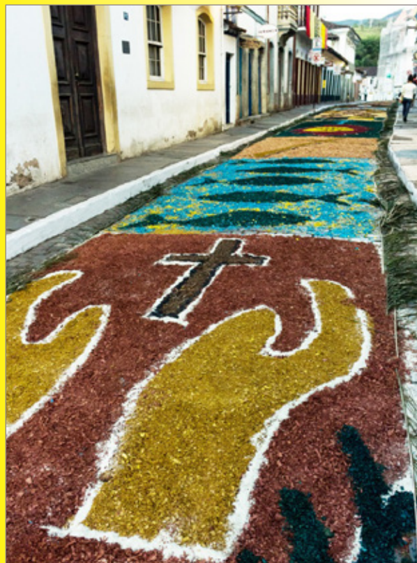
Tapetes de fé na Semana Santa em Mariana