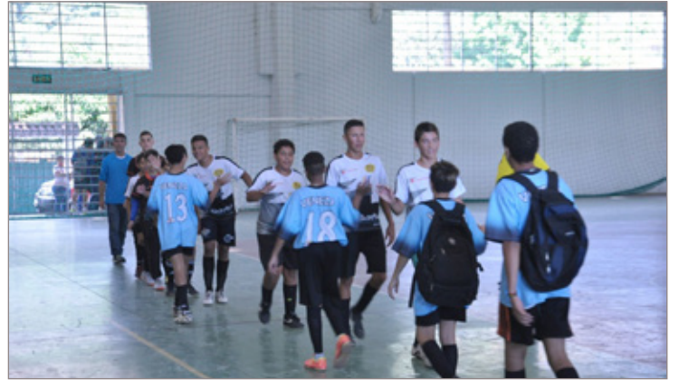
Em alto nível, as partidas foram marcadas pelo clima de amizade

- Itabirito: Vôlei Feminino I - Instituto Santo Antônio de Pádua; Vôlei Feminino II - Instituto Santo Antônio de Pádua; Vôlei Masculino I - Escola Professor Jayme de Souza Martins; Vôlei Masculino II - Escola Municipal José Ferreira Bastos; Basquete Feminino I - Escola Estadual Professor Tibúrcio; Basquete Feminino II - Escola Estadual Intendente Câmara; Basquete Masculino I - Escola Estadual Professor Tibúrcio; Basquete Masculino II - Escola Municipal Manoel Salvador de Oliveira; Handebol Feminino I - Escola Municipal Ana Amélia Queiroz; Handebol Feminino II - Escola Estadual Engenheiro Queiroz Junior; Handebol Masculino I - Escola Municipal Manoel Salvador de Oliveira; Handebol Masculino II - Escola Estadual Engenheiro Queiroz Junior; Futsal Feminino I - Escola Municipal Manoel Salvador de Oliveira; Futsal Feminino II - Escola Estadual Intendente Câmara; Futsal Masculino I - Instituto Santo Antônio de Pádua; Futsal Masculino II - Escola Estadual Engenheiro Queiroz Junior.