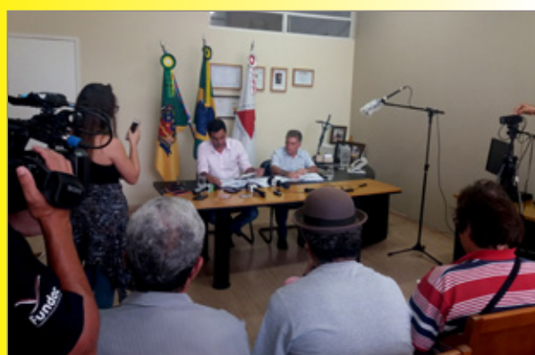
Demissões para equilíbrio de contas em Mariana