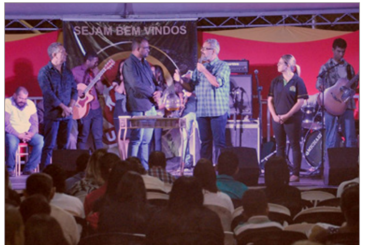
Programação incluiu a apresentação de políticas públicas da Secretaria de Patrimônio Cultural e Turismo

“O UniJovem - uma reflexão em torno da imagem e do comportamento cidadão nas culturas juvenis é um evento que propõe uma imersão em temáticas cidadãs e participativas pontuadas nos Planos Municipais de Cultura e de Turismo. Ambos foram lançados recentemente pela Secretaria Mu-