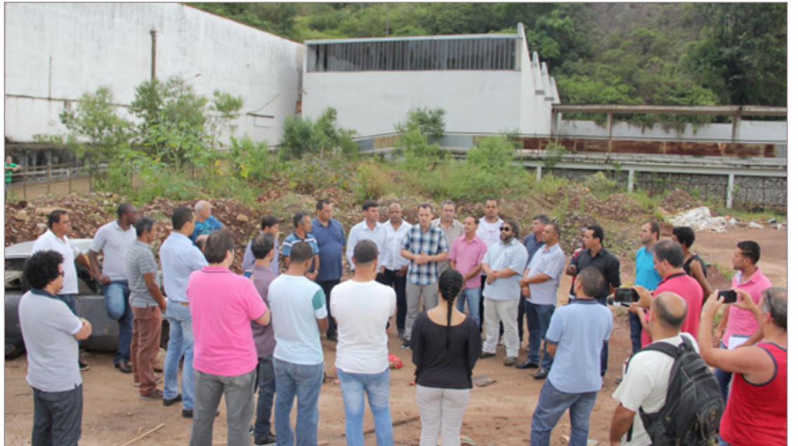
Em janeiro, prefeito e vereadores visitaram a Fábrica de Tecidos

O projeto de construção de uma área para atender aos eventos de Ouro Preto (antiga Fábrica de Tecidos) e uma quadra em Glaura quase foram perdidos por falta de ação da gestão passada, principalmente por causa da manutenção dos convênios junto ao repasse de recursos pela Caixa Econômica Federal – CEF.