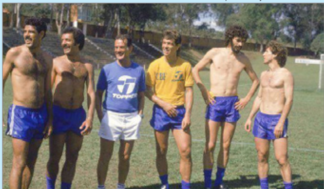
Sem brinco... Sem tatuagem: Cerezo, Júnior, Telê, Edinho, Sócrates e Zico

Venha conferir as novidades Outono/Inverno