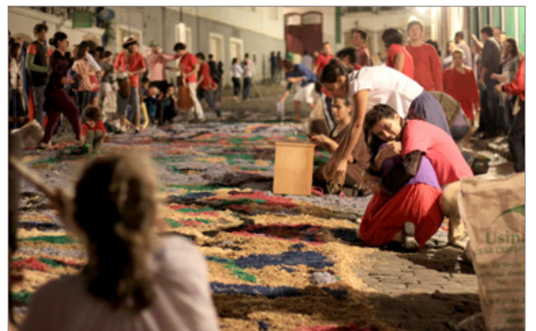
Voluntários confeccionam tapetes na Semana Santa

A confecção de tapetes é voluntária e acontece na noite de sábado (15/04) e madrugada de domingo (16/04). Para participar, ouro-pretanos e turistas precisam apenas comparecer no trajeto e se integrar aos grupos que já trabalham no local. Geralmente, os próprios moradores ficam responsáveis por enfeitar a frente de suas residências. Alguns locais, no entanto, sempre precisam de mais voluntários, por se tratar de uma região comercial. É o caso do trecho entre a Feirinha de Pedra Sabão e a Ponte dos Contos, o qual inclui Praça Tiradentes, Rua Direita e Largo do Cinema.