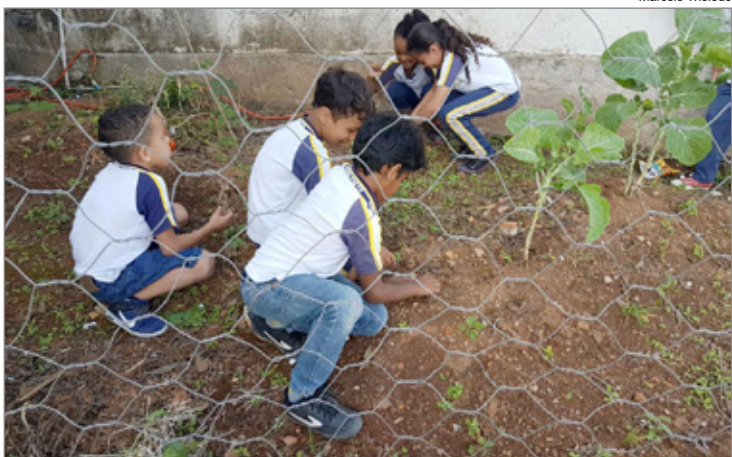
Alunos da E. Mun. Juventina Drummond cuidam da horta na escola

Na matéria “Creche da Cachoeira do Campo em nova sede”, publicada na semana passada, foi informado que a mudança do imóvel que abriga a Creche se deu por meio de parceria com o Lions Clube de Ouro Preto, no entanto, a cessão do imóvel foi efetuada pelo Lions Clube de Cachoeira do Campo. O novo espaço está funcionando no 1º andar da sede do Lions de Cachoeira do Campo.