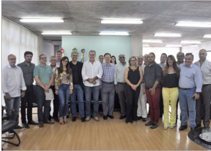
Encontro reuniu representantes de diversos setores públicos

O projeto para a construção da Avenida José Farid Rahme já está aprovado pelo Ministério das Cidades e teve sua primeira etapa finalizada (retirada dos trilhos e nivelamento da área). Agora, aguarda recursos para a sua finalização.