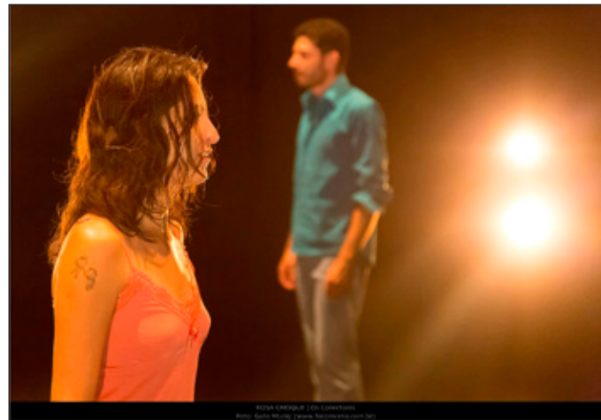
Espetáculo "Rosa Choque" promove debate sobre a violência doméstica