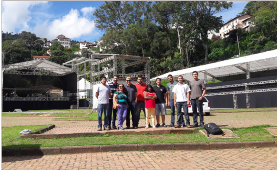
Parceria entre estudantes, Prefeitura e associações destina 3 toneladas de lixo para reciclagem no Carnaval

Ouro Preto é conhecida nacionalmente pelo seu carnaval que atrai milhares de foliões em suas ruas, movimentando o comércio e turismo local. Todo esse público produz muito lixo: garrafas pets, latas de alumínio, garrafas de vidro e etc. Para diminuir o impacto ambiental do Carnaval, a Secretaria Municipal de Meio Ambiente inter-