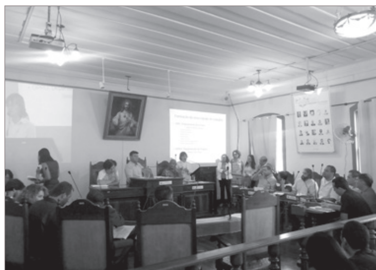
Equipe apresentou dados da Secretaria de Educação