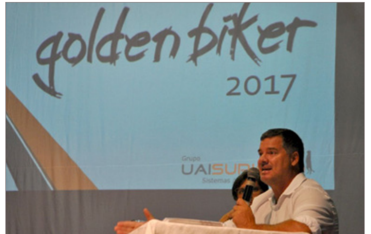
Golden Biker terá estrutura ampliada nesta temporada

Fruto de uma parceria entre a Prefeitura e a Liga Desportiva Municipal de Itabirito (LDMI), o Golden Biker terá a estrutura ampliada