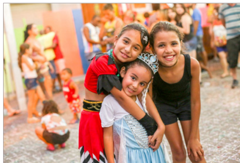
Programação especial promete alegrar pequenos foliões em Itabirito

Confira a programação oficial no site www.mariana.mg.gov.br