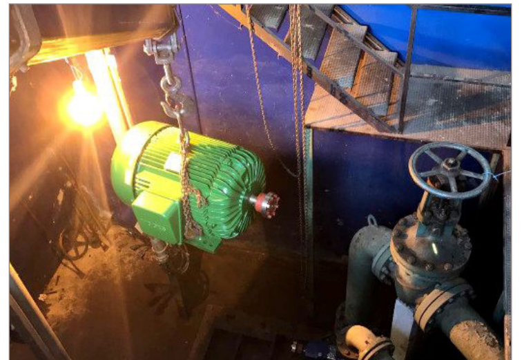
Substituição da bomba de distribuição de água tratada da Eta Itacolomi