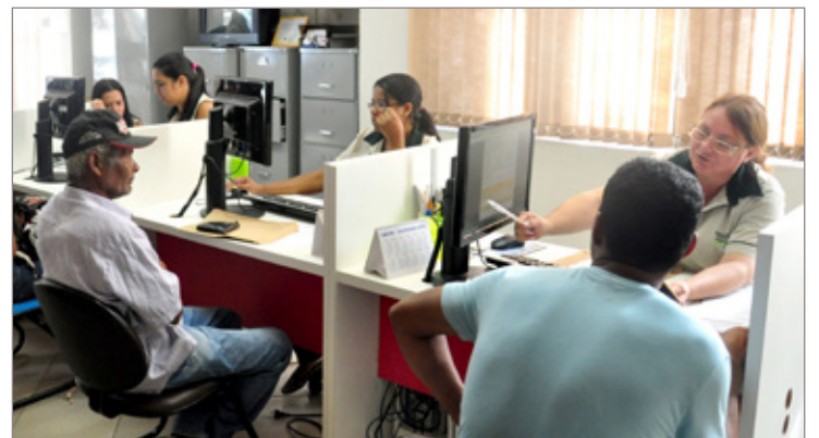
Vagas são oferecidas por meio da agência local do Sine

Conforme projeções apresentadas pela Secretaria Municipal de Desenvolvimento Econômico, foram geradas entre 350 e 400 vagas de emprego no município nos últimos 15 dias.