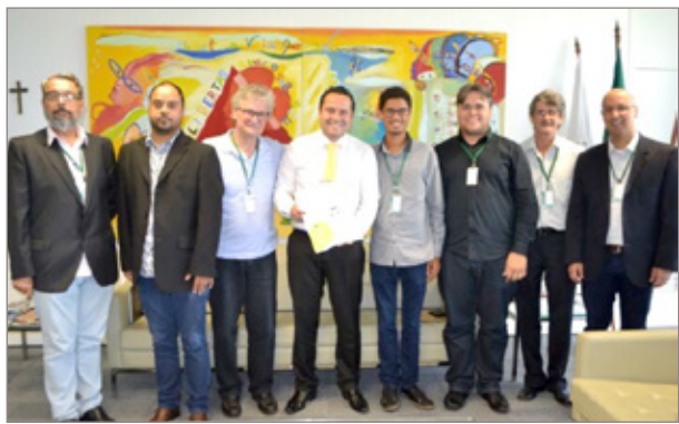
Encontro foi realizado na manhã de 16 de fevereiro e reuniu autoridades de diversos setores