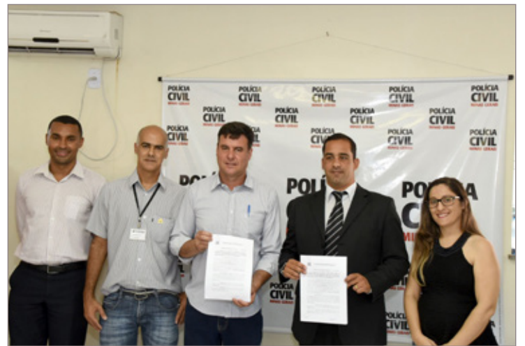
Equipe da Câmara de Ouro Preto com membros da delegacia de Polícia Civil responsáveis pela renovação do contrato

salta o presidente. Atualmente, são emitidos cerca de 600 documentos por mês.