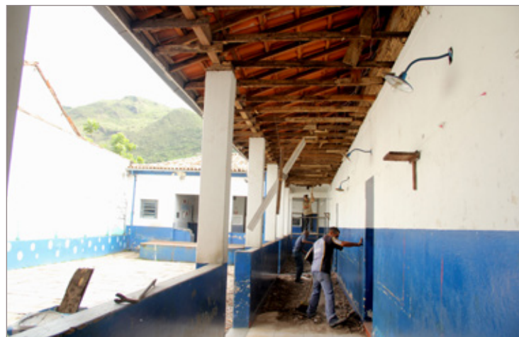
Na Escola Municipal Alfredo Baeta, união de direção e pais permitiu a reforma do telhado, forro da cantina e corredor da escola

A comunidade também tem se mobilizando para auxiliar na limpeza das escolas. Na Escola Municipal Alfredo Baeta, direção e pais se uniram e, por meio de doações e organização de rifas, arrecadaram recursos para fazer a manutenção do telhado e troca do forro da cantina e corredor da escola.