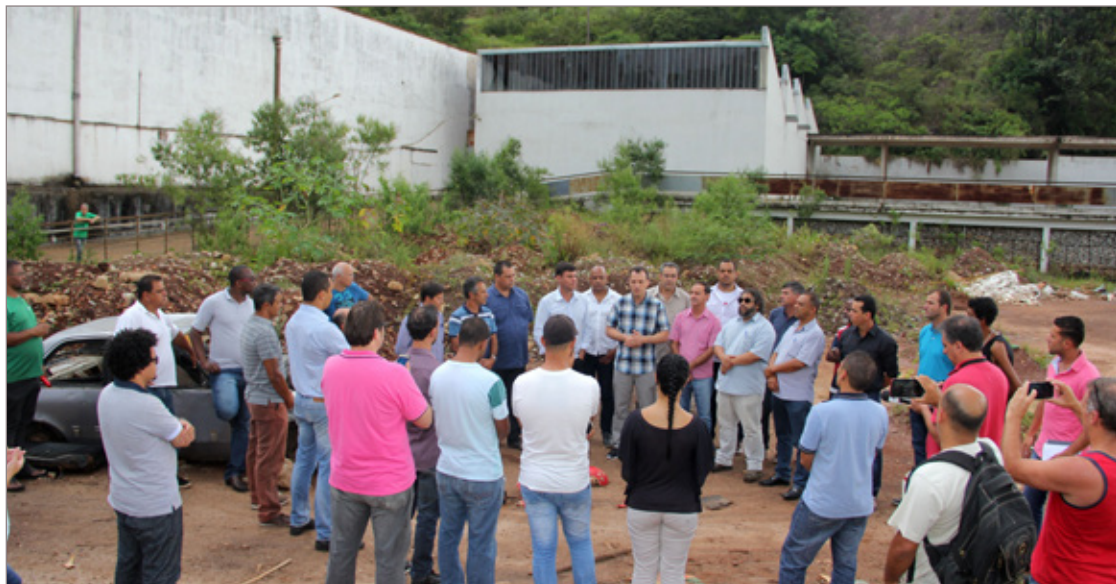
Prefeito anunciou o pagamento durante visita à antiga Fábrica de Tecidos