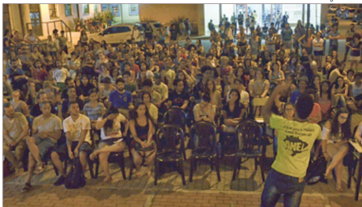
Vários estudantes participaram da assembleia no ICOSA que definiu pela paralisação na quinta-feira (27)