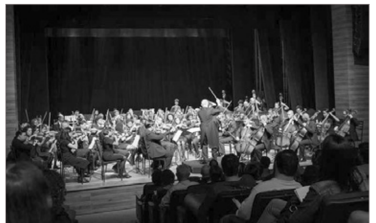
Orquestra Sinfônica de Betim