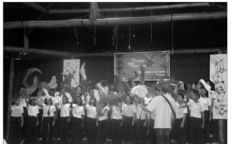
Coral Canto Crescente

Aproxima-se a 14ª edição do "Vozes que Cantam – XIV Encontro de Corais de Mariana", com programações para os dias 11, 18, 19 e 20 de novembro. Estão confirmadas as participações de 15 Corais e ainda da Orquestra Sinfônica de Betim, que entre os seus instrumentistas inclui o jovem trombonista marianense, Wesley Procópio. A entrada em todos os eventos é franca, pedindo-se aos que puderem a oferta de um brinquedo novo ou em bom estado, para a campanha de natal! No facebook (Vozes que Cantam – Encontro de Corais de Mariana) toda a programação, históricos, fotos dos Corais participantes.