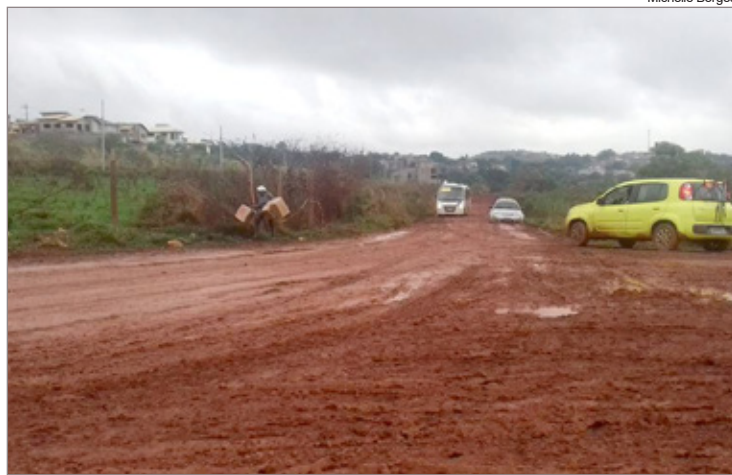
Com as obras inacabadas, o problema de acesso ao bairro tem causado transtornos à população local