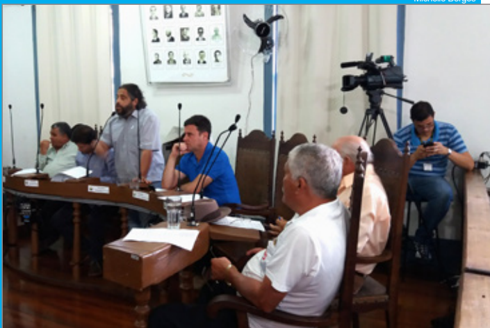
Bancada de oposição afirma que não há garantia de recebimento da dívida