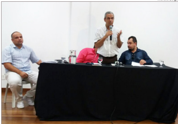
Equipe técnica da prefeitura disse que contrato foi revisado visando menor preço e melhor atendimento