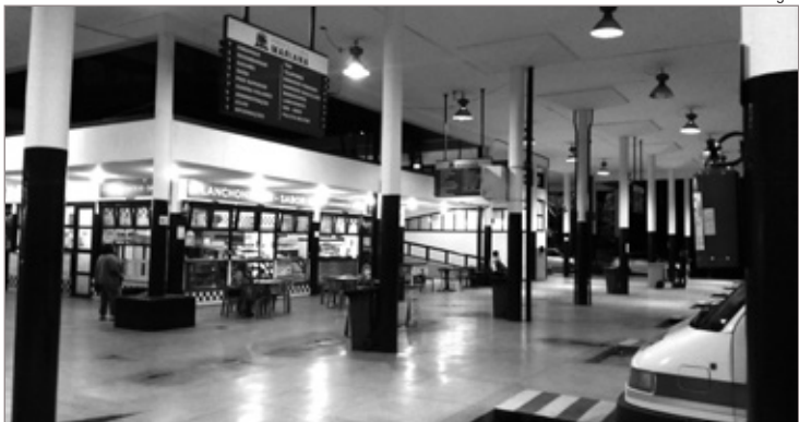
Com a suspensão das paradas, movimento caiu mais de 80% nas lanchonetes da rodoviária de Mariana