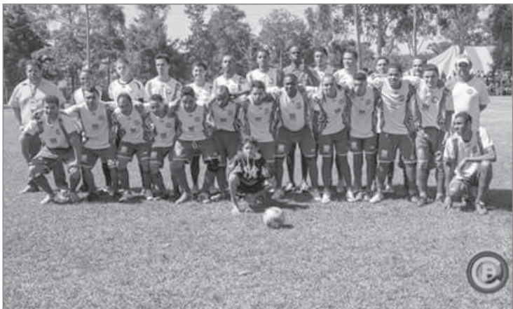
A final do campeonato distrital aconteceu no dia 07 de agosto, entre Casa Branca e Progresso, no campo do Casa Branca. Em uma disputa acirrada, Progresso levou a melhor. A turma do Casa Branca agradece toda a torcida, inclusive a adversária, pela disciplina e valor, e afirma vitoriosos com o resultado de vice, graças a garra, harmonia e respeito mútuo.