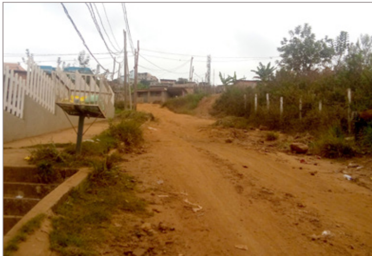
Vereadores acreditam que invasões são uma nova crise no município

Vereadores defendem políticas habitacionais, moradores reclamam da fiscalização e prefeitura garante ações de contenção