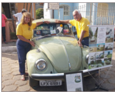
Casal carioca que viaja o mundo foi a grande atração do encontro

Sem fins lucrativos, a organização arrecadou durante a realização do evento, fraldas geriátricas que serão doadas à famílias da região.