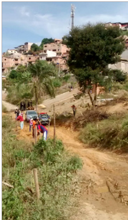
Prefeitura afirma que fiscalização é constante com notificações, retirada de cercas e apreensão de materiais de construção

A prefeitura informou que promove constantemente a fiscalização e apreensão de materiais de construção nas áreas de invasão. Em nota o executivo reafirmou que “os invasores identificados são notificados e as devidas providências são tomadas junto a Procuradoria Geral do Município”. A prefeitura ressaltou ainda que realiza um levantamento para identificar indivíduos infratores, que vendem lotes e barracos para devidas providências judiciais.