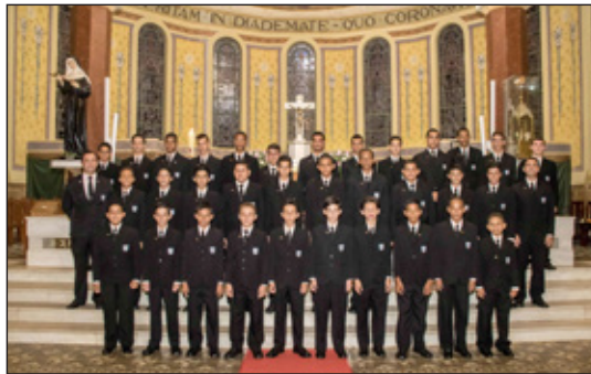
Pequenos Cantores de Cássia

Pequenos Cantores de Cássia e Meninos Cantores de Pratápolis estarão em Itabirito nesse final de semana