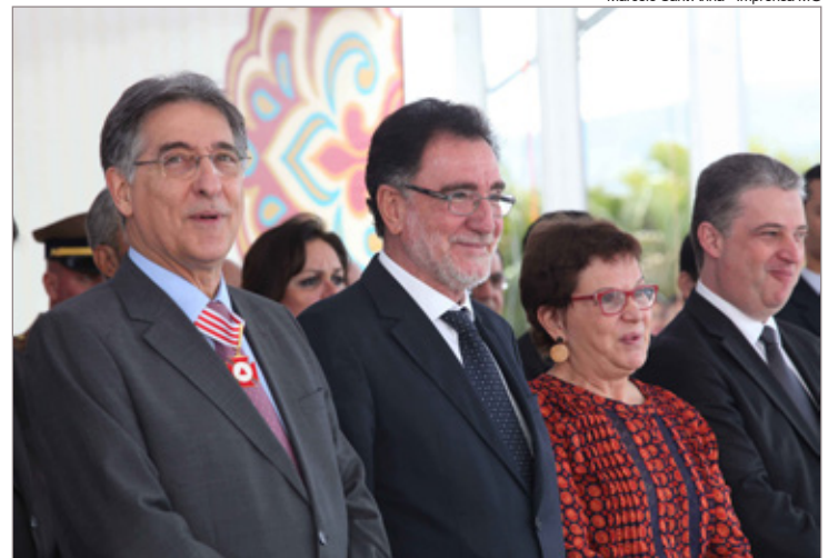
Governo estadual tentou cancelar tradicional cerimônia, mas executivo resolveu empreender esforços para mantê-la (na foto, edição anterior da cerimônia)

seculares, a cidade desperta às 8 horas para celebrar, no Santuário de Nossa Senhora do Carmo, a missa solene em honra a padroeira, celebrada pelo arcebispo dom Geraldo Lyrio Rocha.