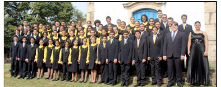
Coral Canarinhos de Itabirito

O Coral Pequenos Cantores de Cássia foi fundado em março de 1972, na cidade de Cássia, sudoeste mineiro, pelo professor e maestro Heitor Combat. A partir de 1994 passou a fazer parte do Centro Musical Heitor Combat com as seguintes atividades: canto coral; banda de música infanto-juvenil; conjunto de flautas-doce; aulas de teoria musical, solfejos, canto orfeônico e de instrumentos de corda, palheta e bocal.