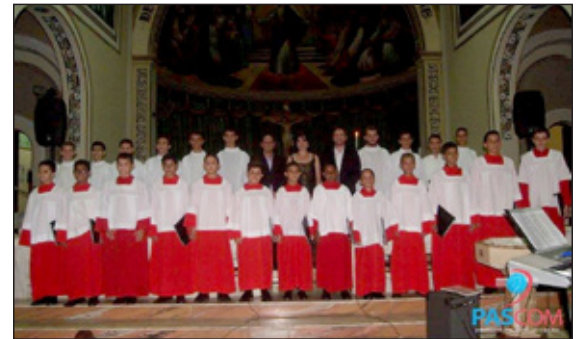
Meninos Cantores do D. E. S de Pratápolis

A partir dessa sexta-feira (15), Itabirito será sede de um Encontro entre os corais Canarinhos de Itabirito, Pequenos Cantores de Cássia (MG) e Meninos Cantores do Divino Espírito Santo de Pratápolis (MG). O evento trará ao público um grande concerto com apresentações gratuitas dos três coros, na Igreja Matriz de Nossa Senhora da Boa Viagem.