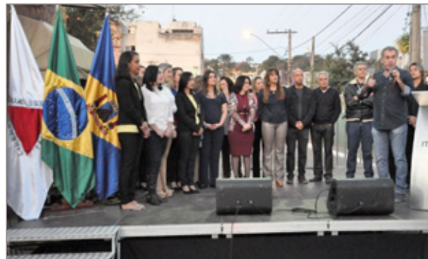
Alunos do coral da Escola Municipal Natália Donada Melilo se apresentaram na cerimônia de inauguração

As escolas que receberam as salas de recursos são a Escola Municipal Guilherme Hallais França, a Escola Municipal José Ferreira Bastos e a Escola Municipal Ana Amélia Queiroz. Os espaços são adaptados para receber crianças com deficiências físicas e intelectuais, transtornos globais de desenvolvimento (autistas e asperges), superdotação e altas habilidades. Entre os equipamentos disponíveis em cada sala estão, por exemplo, lupa para auxiliar o aluno com baixa visão e material escolar adaptado para crianças com dificuldades motoras. Antes da instalação, a única sala de recursos de Itabirito ficava em uma escola estadual.