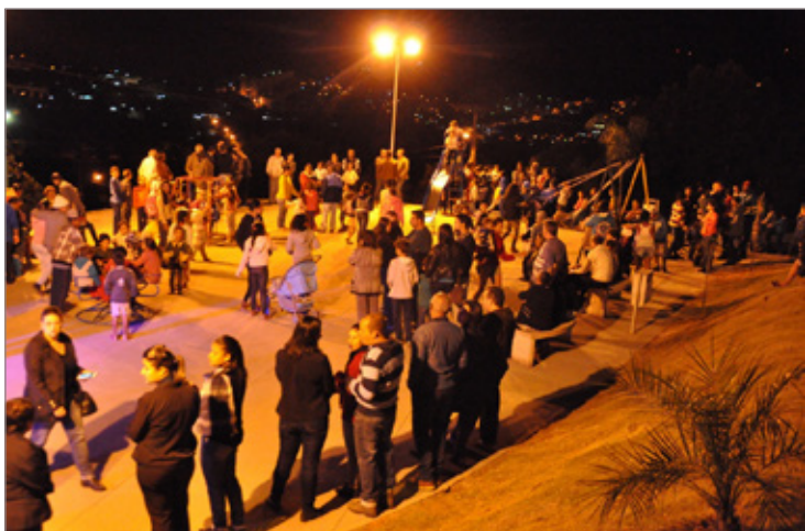
Moradores do Padre Adelmo conheceram nova praça durante inauguração

“Nós sempre quisemos usar esse espaço para o encontro das famílias e com essa praça isso será possível. Mas, o que o bairro recebe de mais importante este ano não é uma obra física e sim as escrituras dos terrenos, que é algo que vai dar muita tranquilidade aos moradores desse bairro tão importante de Itabirito”.