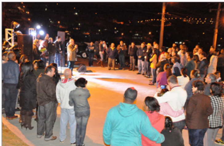
Prefeito fala para a população do Padre Adelmo

“Já havia esse projeto de criar um ponto de lazer no bairro. O local dessa praça é estratégico, porque é muito alto e bonito, quase um mirante. Como está sendo realizada a semana missionária, a Prefeitura agilizou o processo de conclusão do espaço em respeito à tradição religiosa do bairro”, afirma o secretário de Obras e Servi-