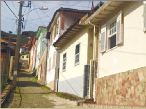
Rua Jair Afonso Inácio, Bairro Alto das Dores