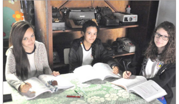
Objeto de desejo dos participantes da Obmep é conquistar uma medalha na competição