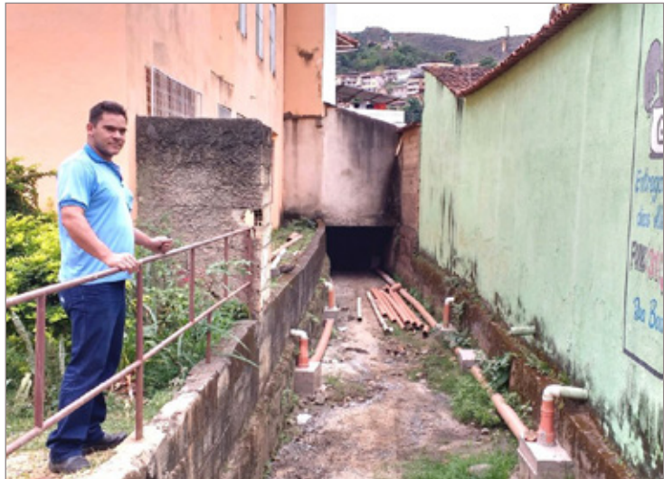
Servidores do SAAE mostram córrego seco após canalização do esgoto