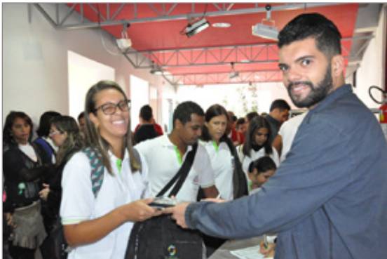
Agentes de saúde recebem tablet para auxílio na realização de visitas à população