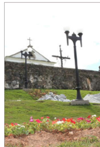
Obra de revitalização é a primeira realizada com recursos do Fundo de Preservação do Patrimônio Cultural (Funpac), que é alimentado com verba advinda do ICMS Cultural