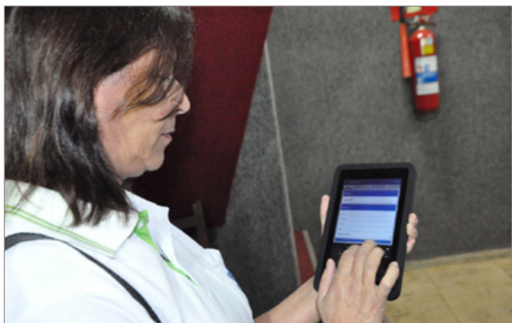
Agente de saúde confere sistema de preenchimento de dados