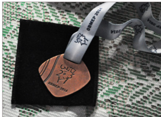
OMI serve como preparação para competição nacional de matemática

Todos os anos, quase 20 milhões de alunos de escolas públicas em todos os estados da federação fazem as provas da Olimpíada em busca não só de um bom resultado, mas de uma medalha. Os alunos com as melhores notas nas provas de matemática da Olimpíada são premiados com medalhas de ouro, prata, bronze ou menções honrosas. A Obmep distribui seis mil medalhas aos melhores alunos em todo o país, sendo 500 de ouro, 1500 de prata e 4500 de bronze. Além disso, também são distribuídas cerca de 46 mil menções honrosas.