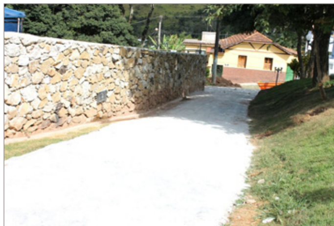
No Rosário, foram construídos muros e pavimentada uma rua que facilitou o acesso dos moradores

Nas obras de revitalização foram instalados 32 postes de luz, seis refletores e 51 luminárias solares de jardim. Além disso, cerca de 250 metros quadrados de pavimentação foram feitas. Também foi realizado o plantio de 1,8mil m² de grama e mais de 12 mil mudas de flores foram utilizadas nos espaços históricos.