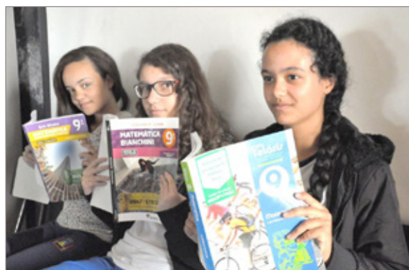
Medalhistas da Obmep em edições anteriores se preparam para conquistar novas premiações em 2016