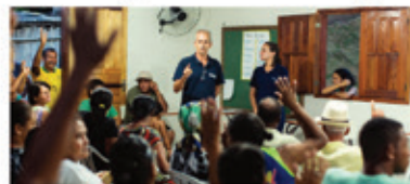
Moradores de Gesteira aprovam proposta da Samarco para a reconstrução da Escola Municipal Gustavo Capanema