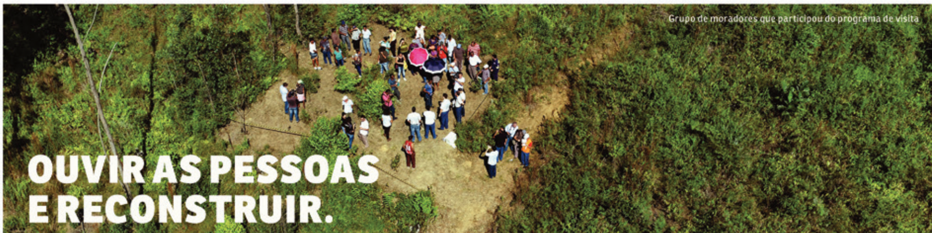
Grupo de moradores que participou do programa de visita