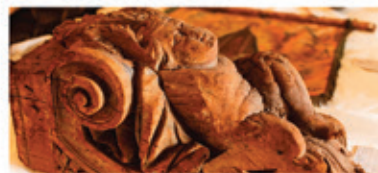
Aproximadamente 400 obras sacras de Mariana e região estão sendo restauradas