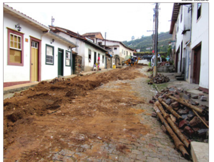
Smae substituiu rede de água na rua Barão do Ouro Branco