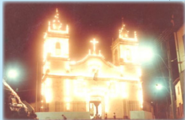
Igreja da Padroeira Nossa Senhora da Boa Viagem