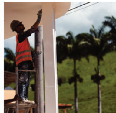
De 146 casas e estabelecimentos comerciais atingidos em Barra Longa, 82 já tiveram suas reformas concluídas e em outros 35 as obras já foram iniciadas

Para saber mais e conhecer outras ações, acesse www.samarco.com .