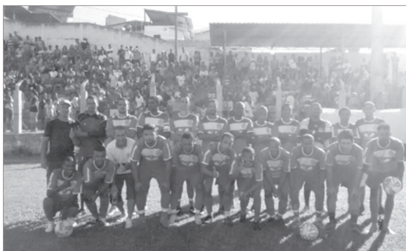
A comunidade de Santo Antônio do Leite e de Cachoeira do Campo parabeniza o União Futebol Clube pela conquista do título do Campeonato Cachoeirão, com final dia 17 de abril, no campo do Cruzeiro e vitória de 2x1 sobre o Thilangos. Parabéns!