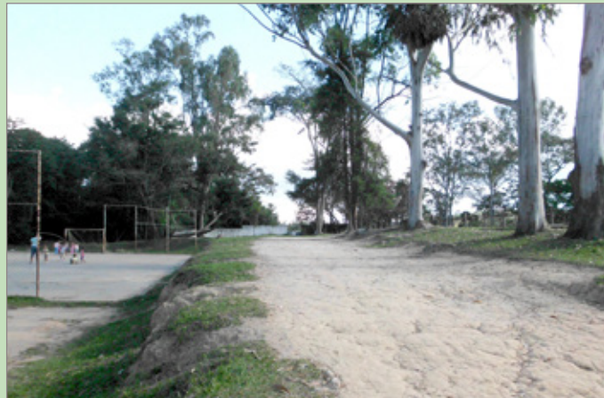
Rua não pavimentada no distrito de Glaura