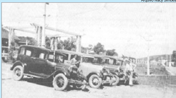
Praça de táxi

O alto do Cristo foi palco da 1ª Etapa da Copa Mineira de DownHill – Desafio do Ouro II, no último domingo, 10 de abril. Cerca de 140 atletas de todo o Brasil e do Chile participaram da prova de 1800m de descida em alta velocidade com obstáculos. A corrida também contou pontos para o ranking nacional da Confederação Brasileira de Ciclismo (CBC).