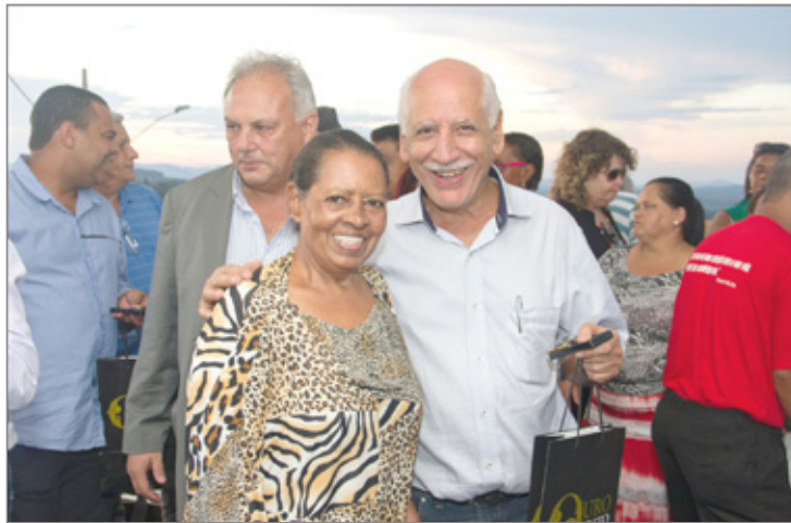
Prefeito entrega chave da casa à moradora do Residencial Vila Alegre

“A gente construiu um pequeno bairro, são 96 casas em ruas total-