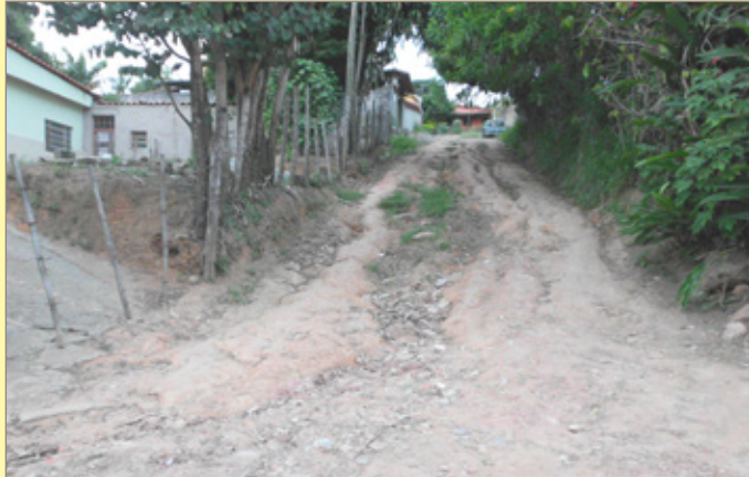
Rua no Alto da Boa Vista em Santo Antônio do Leite