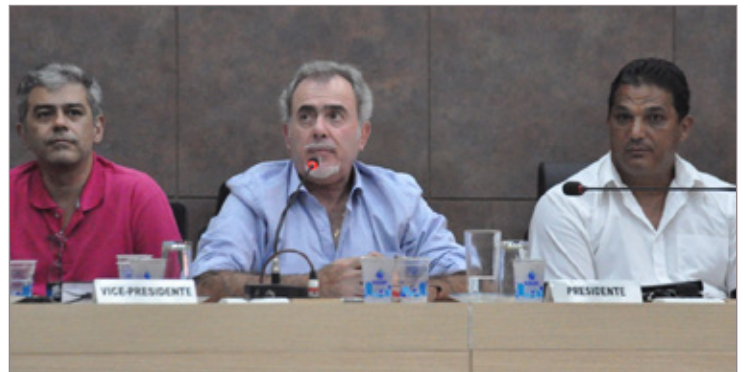
Prefeito Alex respondeu a perguntas dos vereadores

do canil municipal e sobre a ação da Prefeitura junto às empresas responsáveis pela coloração avermelhada do rio da cidade. O prefeito explicou as ações da administração pública em todas as perguntas levantadas. Ele destacou que já está em estudo um edital de licitação para reforma do canil e que a Prefeitura tem agido até o seu limite legal e aplicado multas às empresas responsáveis pela cor do rio.