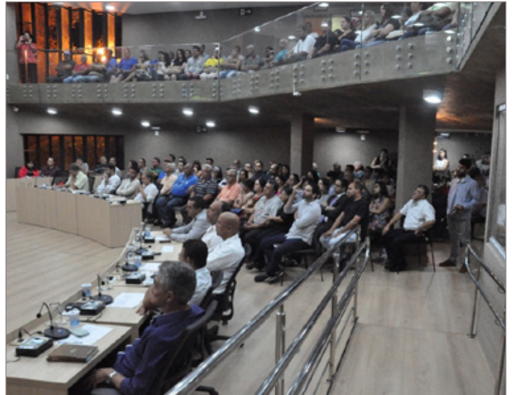
Plenário da Câmara ficou lotado durante a reunião

O chefe do executivo municipal também foi questionado quanto a outras questões, como, a situação