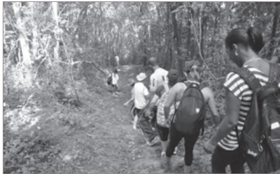
O percurso foi de 8 km nas proximidades da represa Rio das Pedras