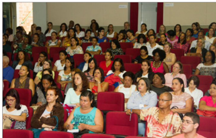
Professores da Rede Pública participam da palestra na abertura do ano letivo 2016