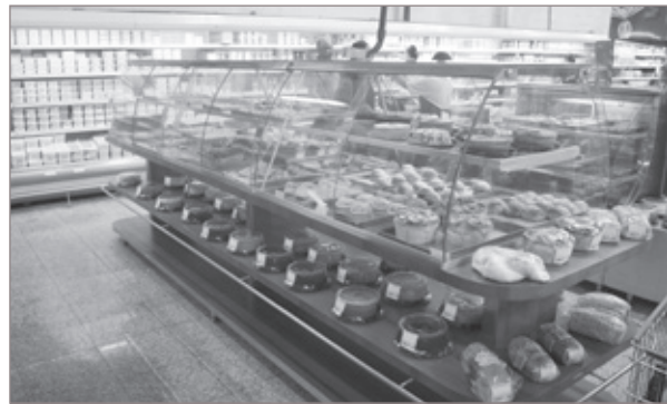
Cooperouro e Tutti Pani agora são parceiras em Ouro Preto

Agora, as lojas da Cooperouro em Ouro Preto são parceiras da Tutti Pani padaria e confeitaria. Tradicional em Ouro Preto, a nova padaria da Cooperouro veio trazer o que há de melhor em pães, bolos, quitutes, doces, salgados e muito mais. O Festival de Pães e Bolos Cooperouro acontece de sexta (11) a domingo (13), na Cooperouro Matriz e na Cooperouro Cabeças, em Ouro Preto. As degustações ocorrem na sexta-feira, a partir das 14h, no sábado e no domingo, a partir das 9h. Participe!