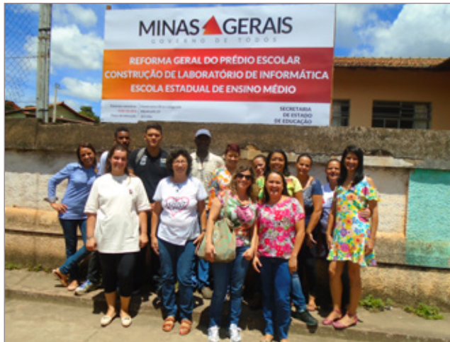
A Escola Estadual de Ensino Médio de Amarantina vai passar por reformas. As obras começam dia 14/03, começando pelo muro da escola. Espera-se significativa melhoria na infraestrutura do local.