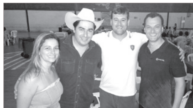
No último domingo, 24 de janeiro, aconteceu a 1ª edição do Festival de Arte Culinária da Associação Atlética Aluminas. O evento foi inspirado no festivais de culinária e artesanato realizados pelo ex-secretário de Cultura e Turismo Gleiser Boroni, à época ocorria no estacionamento do Centro de Convenções, do Bairro Pilar. O objetivo é proporcionar aos ouropretanos, momentos de lazer unidos à gastronomia regional e sendo realizado todos os domingos, a partir de 12h até as 20h, criando em Ouro Preto um espaço para congregação das famílias, onde poderão degustar e saborear uma culinária local e diferenciada, um espaço kids, para as crianças. No próximo, dia 31, acontece a 2ª edição do Festival de Arte e Culinária da AAA. Não percam!