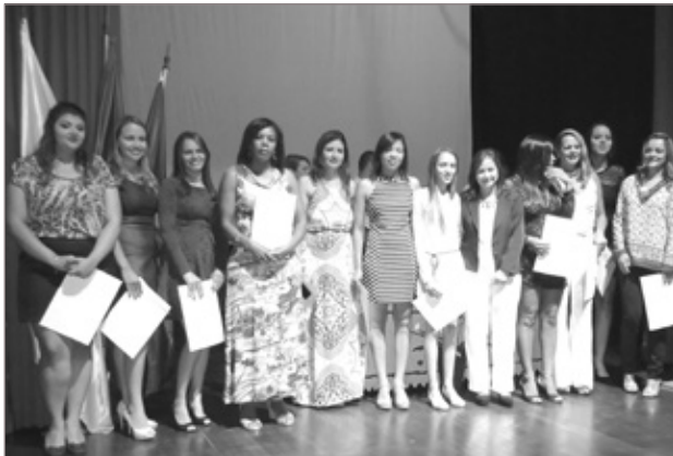
Cerca de 100 alunos concluíram cursos profissionalizantes

II - convocar as reuniões da Assembleia Geral e da Diretoria Administrativa, presidindo os trabalhos desta e da instalação da primeira, bem como, quando necessário, solicitar reunião do Conselho Deliberativo.