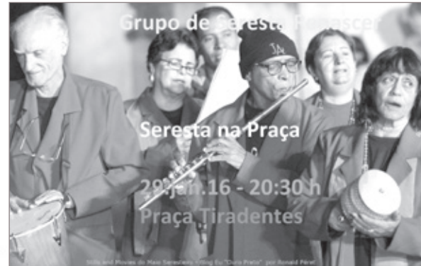
Na última sexta-feira de cada mês, o Grupo de Seresta renascer estará presente na Praça Tiradentes, levando a boa música seresteira ao público ouropretano e visitantes, com o objetivo de manter viva a tradição cultural da serenata.