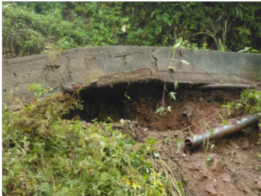
Situação da Rua Águas Férreas no Taquaral preocupa moradores

A constante chuva dos últimos dias já causa preocupação aos moradores de Ouro Preto, que sofrem com os deslizamentos de terra. Os bairros Alto da Cruz, Padre Faria e Santa Cruz já sentiram os impactos da chuva, que já dura mais de uma semana.