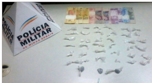
Material apreendido pela Polícia Militar em Itabirito

Na terça-feira (12) a Polícia Militar recebeu denúncia de tráfico de drogas no bairro Padre Eustáquio, em Itabirito. Após diligências, o indivíduo denunciado, que tem 26 anos, foi encontrado com quatro pedras semelhantes a crack. Ele afirmou ter adquirido a droga com outro homem, de 43 anos. Na casa deste, foram localizadas e apreendidas outras drogas, como cocaína, crack e maconha, além de R$ 94,00 em dinheiro. Os autores foram presos e encaminhados, junto ao material apreendido pela Polícia Militar, para a Delegacia de Polícia Civil para demais providências.