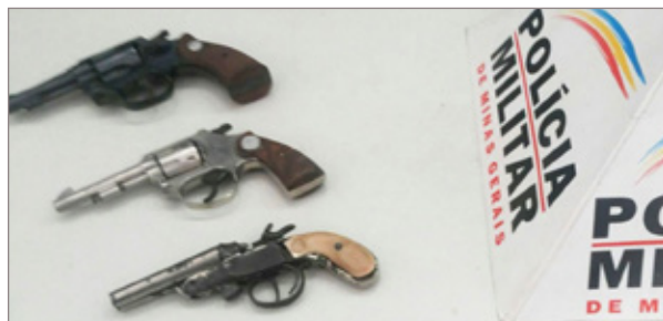
Armas apreendidas pela Polícia Militar em Itabirito

Na sexta-feira (8), a Polícia Militar recebeu denúncia de posse ilegal de arma de fogo no bairro Santa Efigênia, em Itabirito. No local, policiais militares abordaram um senhor de 72 anos, com o qual foram encontrados e apreendidos: dois revólveres do calibre 22 e um calibre 32, os quais possuíam registros, mas que estavam vencidos. Diante do exposto, o senhor foi encaminhado para a Delegacia de Polícia Civil para demais providências, junto às armas apreendidas pela Polícia Militar.