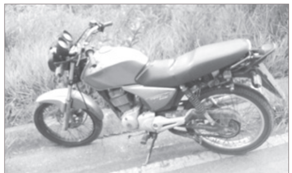
Moto recuperada pela Polícia Militar em Ouro Preto

No domingo (10) policiais militares avistaram uma moto sem placa e sem retrovisores em Lavras Novas, distrito de Ouro Preto. O condutor do veículo negou-se a parar para averiguação e fugiu sentido Saramenha. No bairro, a polícia apreendeu a motocicleta, mas o indivíduo fugiu. O veículo foi encaminhado para o pátio credenciado, para demais providências.