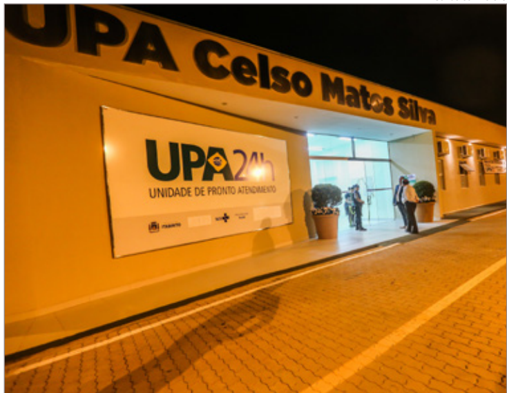
Em um ano de funcionamento, cerca de 70 mil pessoas foram atendidas na nova UPA