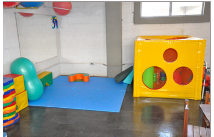
Os novos equipamentos já estão sendo usados no CER

Em breve, será realizado o segundo mutirão de entrega de próteses de membros inferiores, palmilhas, bengalas e muletas.