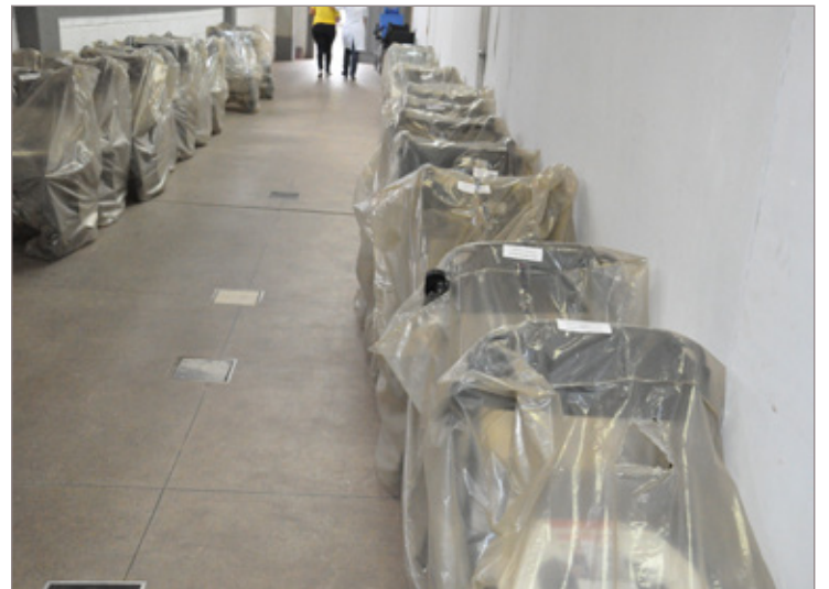
Durante os mutirões são entregues cadeiras de rodas e de banho