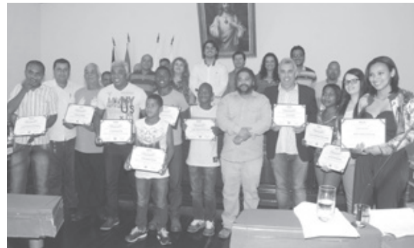
Homenageados com as Moções de Aplauso 2015 e vereadores na Câmara Municipal de Ouro Preto