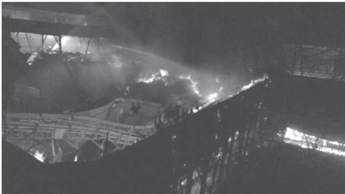
Incêndio atingiu cerca de seis mil metros cúbicos do depósito de carvão

Foi necessário o trabalho dos Bombeiros de Ouro Preto, Itabirito e Belo Horizonte para controlar as chamas