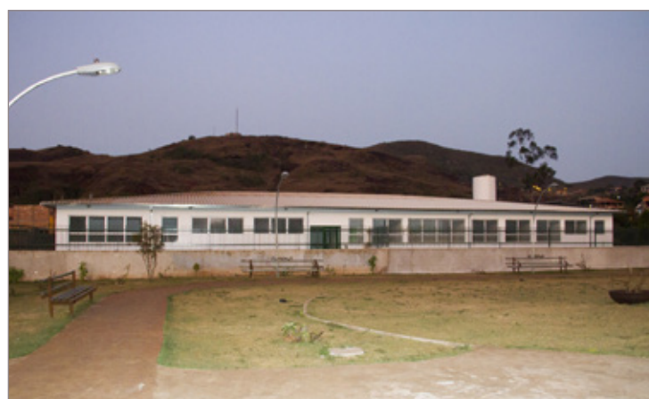
Prefeitura construiu um novo prédio para a UBS de Antônio Pereira